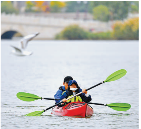
红嘴鸥不时与皮筏艇“擦肩而过”。

10月5日,银川海宝公园,市民与红嘴鸥和谐共处。连续阴雨、降温过后,在柔和秋风的轻拂下,北塔湖水面微波荡漾,湖城银川的“荣誉市民”——红嘴鸥,像从前一样,如约而至,或静静地浮在水面上休息,或上下翻飞,自由翱翔。