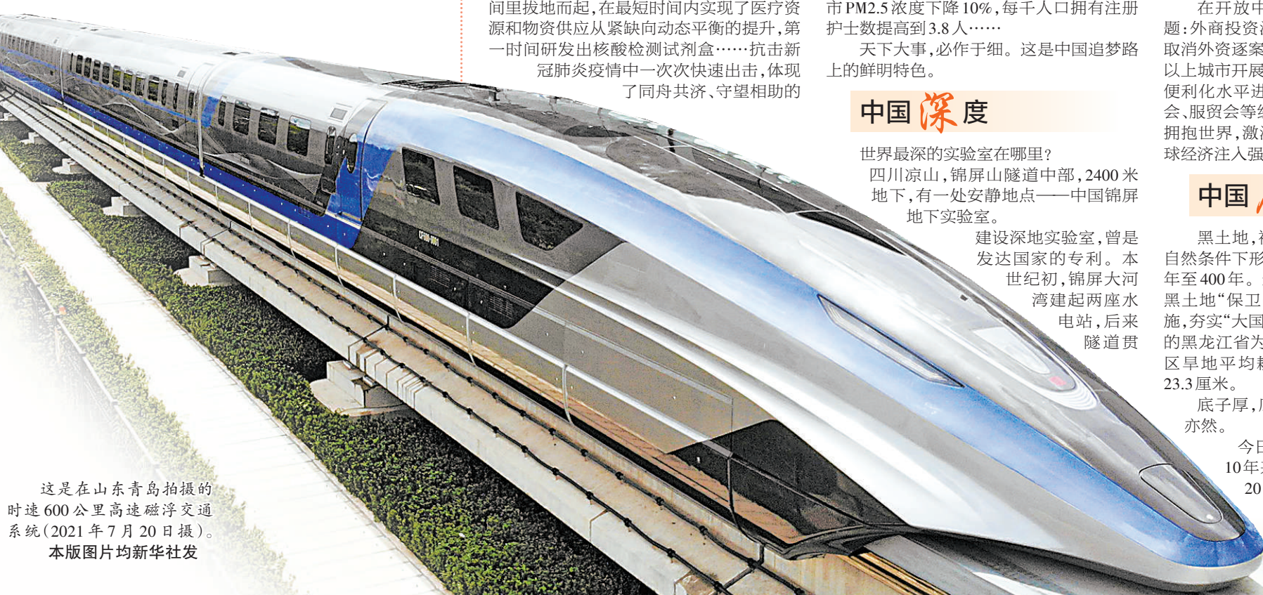
这是在山东青岛拍摄的时速600公里高速磁浮交通系统(2021年7月20日摄)。