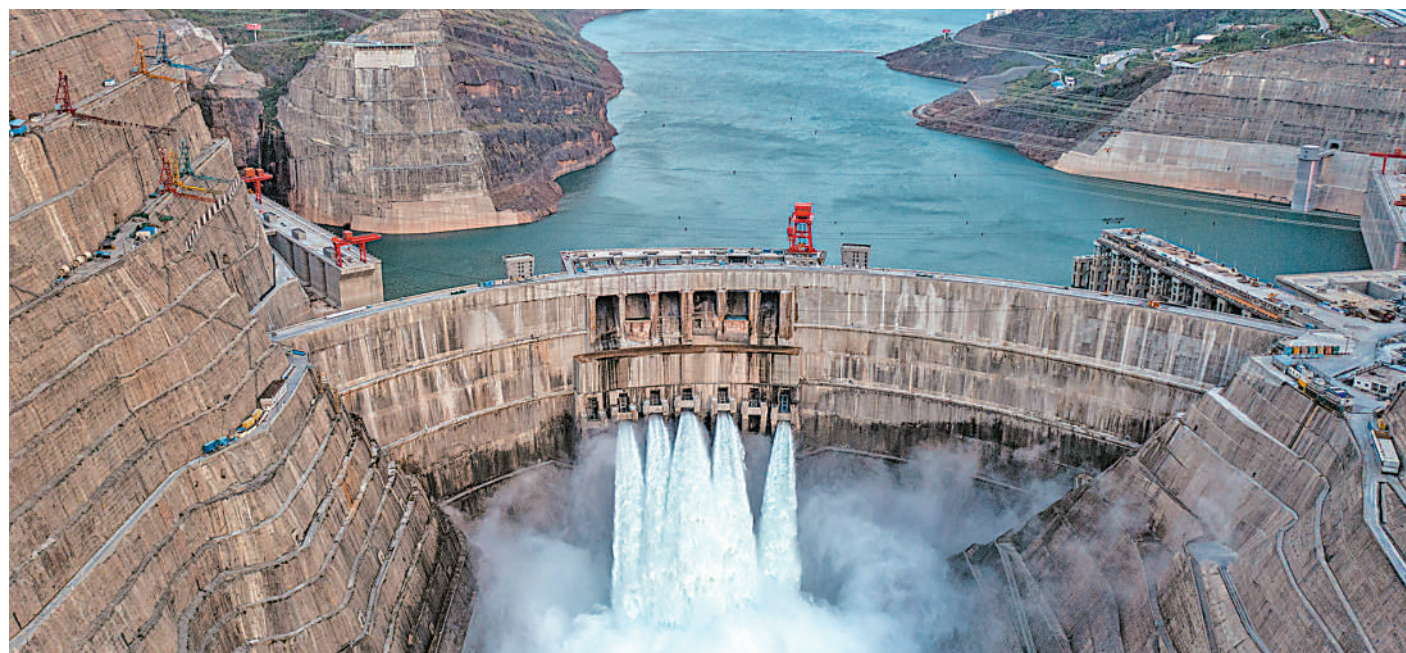
这是白鹤滩水电站(2022年5月29日摄)。