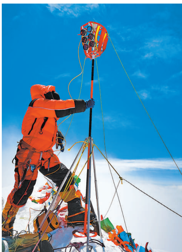
2020珠峰高程测量登山队队员在珠穆朗玛峰峰顶开展测量工作(2020年5月27日摄)。

一项项重点工程、一个个国之重器、一次次创新突破……新时代的伟大变革中,不同维度的独特标识记录下中国的非凡十年。