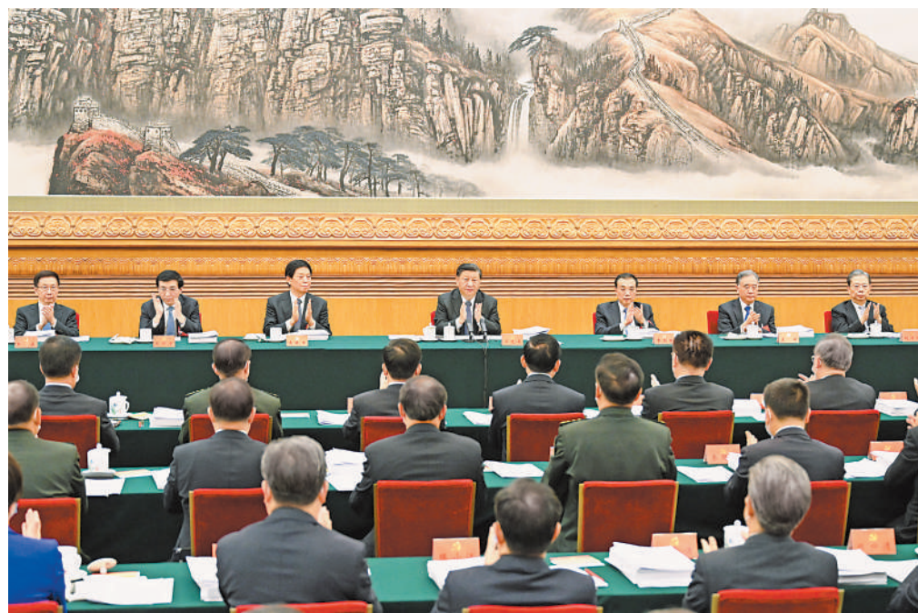
10月18日,中国共产党第二十次全国代表大会主席团在北京人民大会堂举行第二次会议。习近平、李克强、栗战书、汪洋、王沪宁、赵乐际、韩正等出席会议。

新华社北京10月18日电 中国共产党第二十次全国代表大会主席团18日下午在人民大会堂举行第二次会议。 习近平同志主持会议。 会议通过了将关于十九届中央委员会报