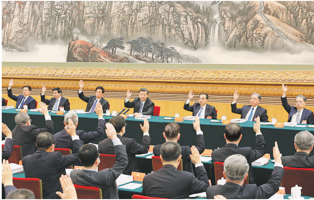
10月21日,中国共产党第二十次全国代表大会主席团在北京人民大会堂举行第三次会议。习近平、李克强、栗战书、汪洋、王沪宁、赵乐际、韩正等出席会议。

新华社北京10月21日电 中国共产党第二十次全国代表大会主席团21日上午在人民大会堂举行第三次会议,通过二十届中央委员会、候补中央委员和中央纪委委员候选人名单(草案),提交各代表团酝酿。习近平同志主持会议。 会议通过了经各代表团差额预选产生的二十届中央委员会委员、候补委员和中央纪委