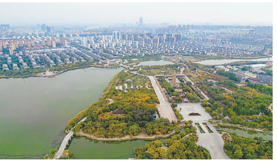
2022年10月19日,从空中俯瞰银川海宝公园,水天一色,掩映于绿意间的休闲步道蜿蜒曲折,这里俨然成了城市的“绿肺”。