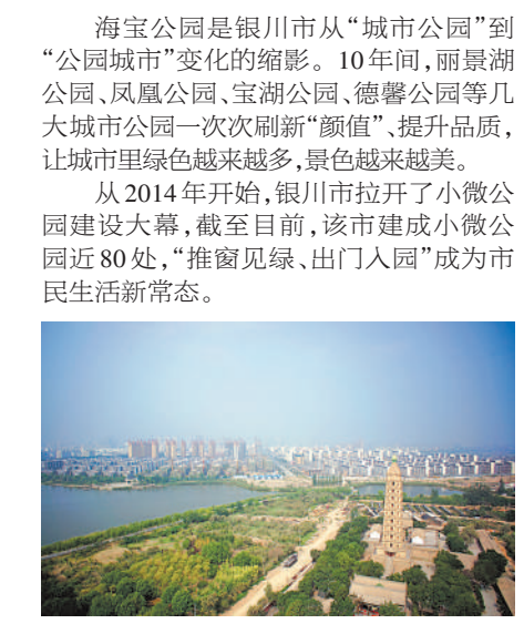
2013年8月26日,记者航拍的银川海宝公园。(资料图片)