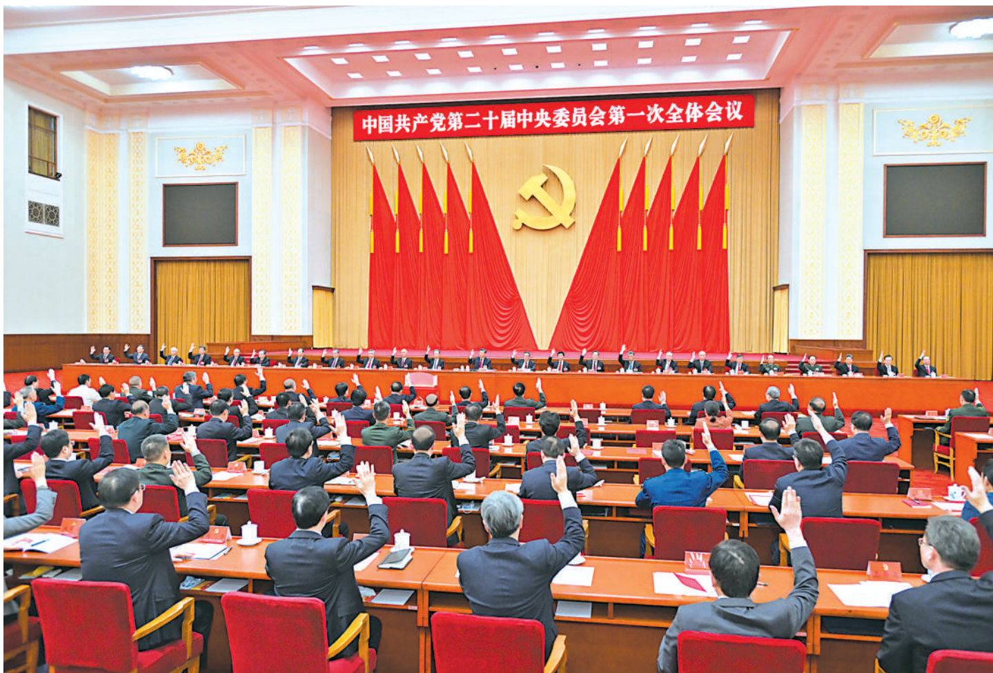
10月23日,中国共产党第二十届中央委员会第一次全体会议在北京人民大会堂举行。