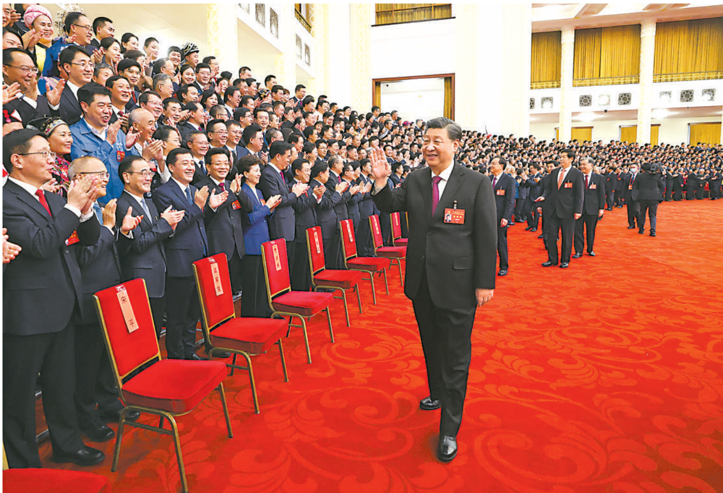
10月23日下午,中共中央总书记、国家主席、中央军委主席习近平等领导同志在北京人民大会堂亲切会见出席党的二十大代表、特邀代表和列席人员,并同大家合影留念。