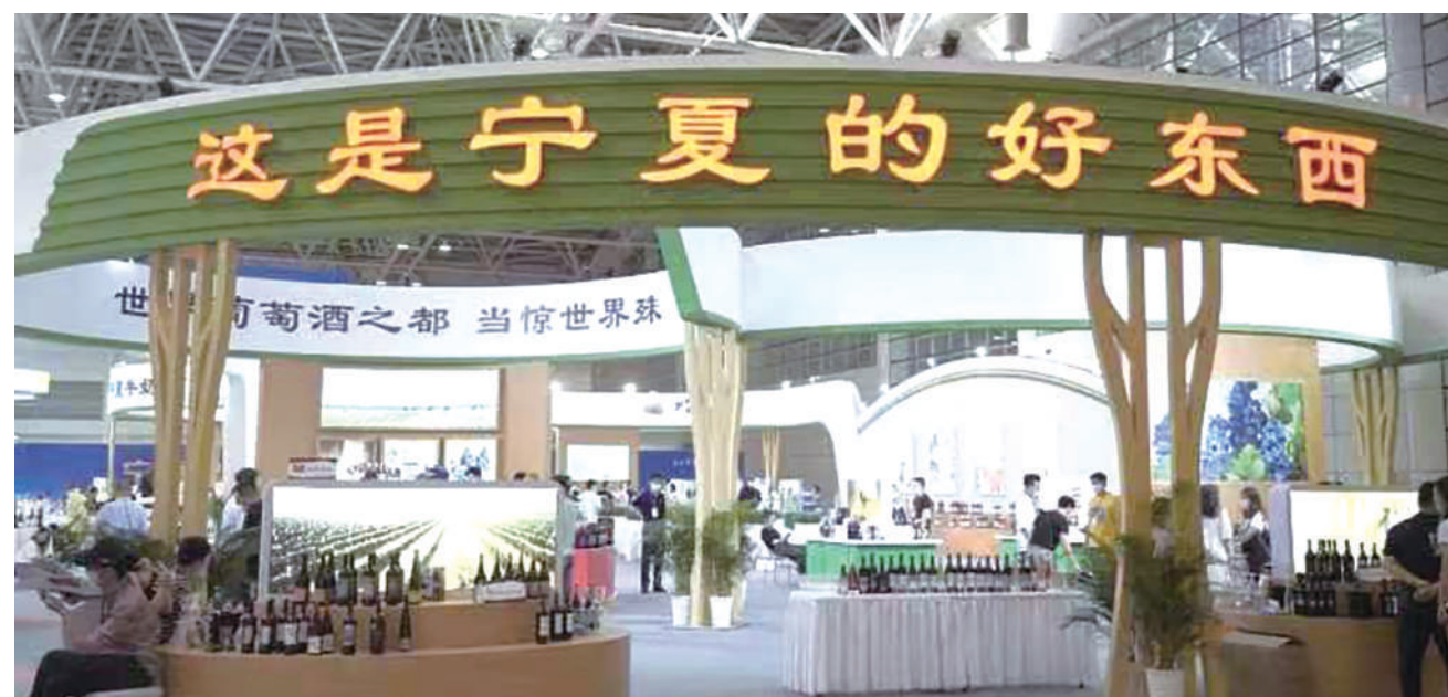
举办“宁夏品质中国行”宣传推介活动。