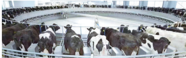
奶牛转盘式挤奶台。