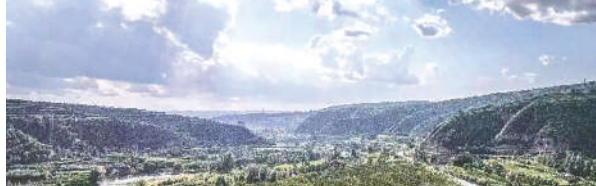
塞上江南·美丽村庄。