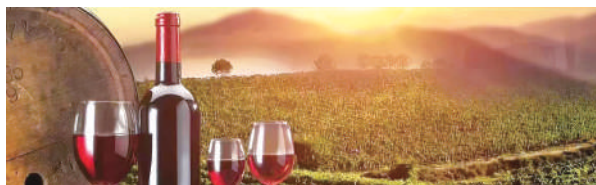
贺兰山东麓葡萄酒。

巍巍贺兰山见证变迁,潺潺黄河水流润山川。 金秋时节,塞上江南五谷丰登,层林尽染,叠翠流金,田野穿金甲,山川披彩裳,一派丰饶图景。 重农固本,国之大计。十年来,宁夏牢记嘱托、踔厉奋发、勇毅前行,坚持党对“三农”工作的全面领导,始终把解决好“三农”问题作为重中之重,落实五级书记抓乡村振兴要求,以黄河流域生态保护和高质量发展先行区建设为牵引,以高质量发展为主题,以农业供给侧结构性改革为主线,打赢脱贫攻坚战,实施乡村振兴战略,全面建设社会主义现代化美丽新宁夏。质量提升、效益跃升,农业生产更加高质高效;基础设施强起来、公共服务优起来,美丽乡村更加宜居宜业;口袋“鼓”、脑袋“富”,农民生活更加富裕充实;全区第一产业增加值由200.2亿元增加到364.5亿元,年均增长6.9%;农村居民人均可支配收入由6180元增加到15337元,年均增长10.6%……广袤田野绘就乡村振兴壮美画卷,谱写出宁夏非几千年农业农村新篇章。