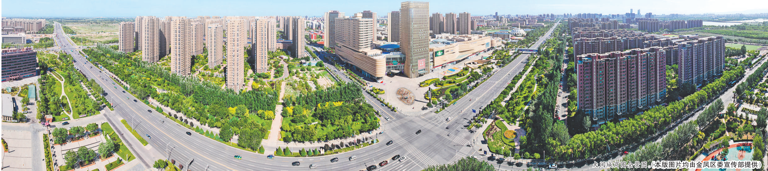
大阅城阅城全景图。