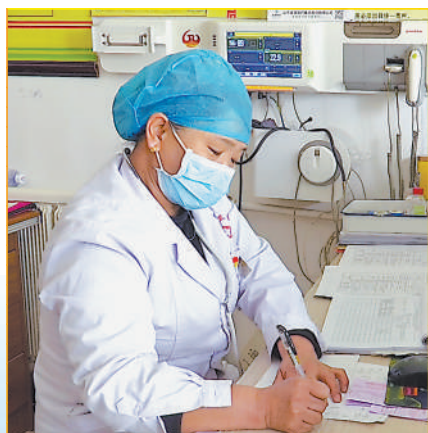
农村医疗设备齐全,“互联网+医疗”让群众看病少跑路。