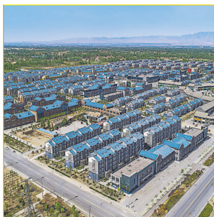
规划整齐的美丽乡村。