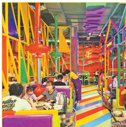
“夜经济”增添城市发展活力。