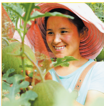
产业发展促进农民收入节节攀升。