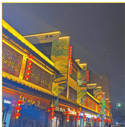
打造“最美回家路”——新昌路。

伴随着学习宣传贯彻党的二十大精神的热潮,金凤区号召广大干部群众迅速将思想和行动统一到党的二十大精神上来,把智慧和力量凝聚到实现党的二十大确定的各项目标任务上来,踔厉奋发、勇毅前行,努力在加快建设黄河流域生态保护和高质量发展先行区的进程中走在前列、勇立潮头,以实干成就梦想,用奋斗创造未来。