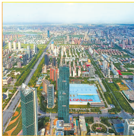
不断拉大的城市框架。