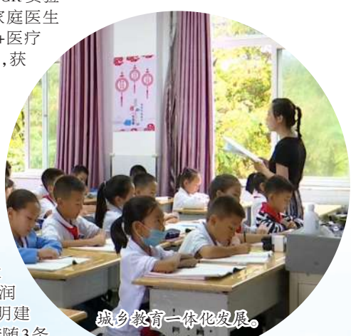
城乡教育一体化发展。

沿着党的二十大指引的方向,金凤区将深入学习贯彻党的二十大精神,坚持以推动高质量发展为主题,发扬实干、苦干和巧干精神,将擘画的发展蓝图变为群众的美好生活,把政策红利转化为生产力、发展力、竞争力,加快创新、产业、市场、人口四个关键变量的塑造,持续提升传统优势,加快突破新生优势,深入挖掘潜在优势,以青春之力践行责任担当,只争朝夕、再创佳绩。