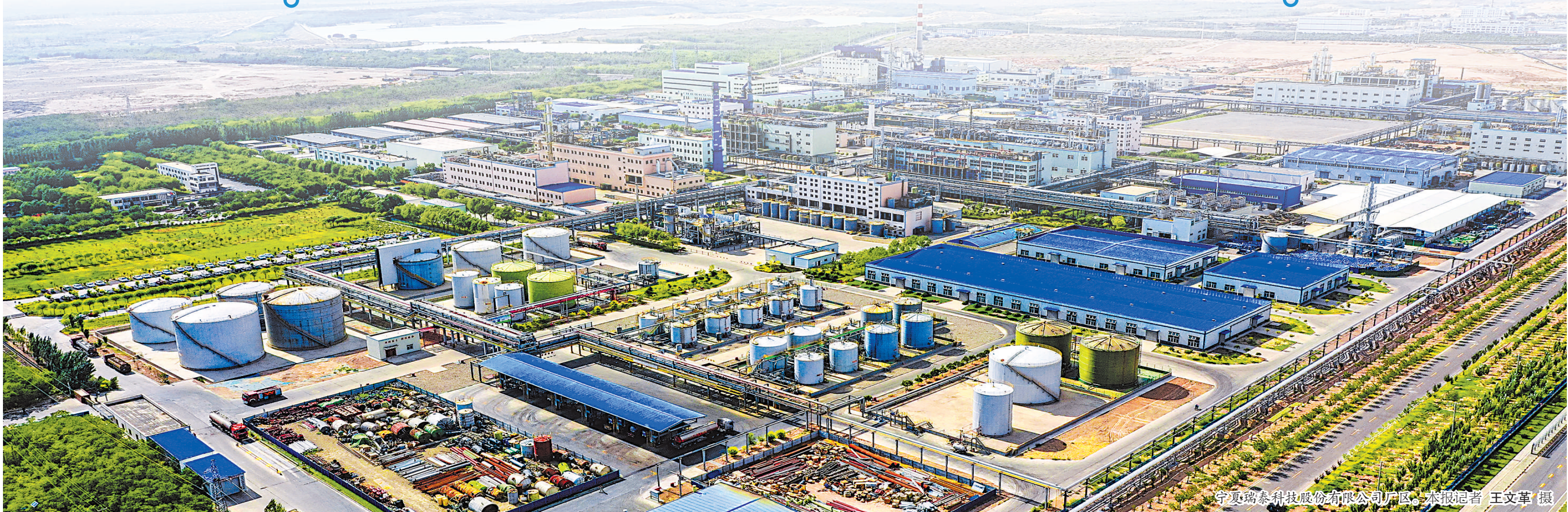
宁夏瑞泰科技股份有限公司厂区。

石嘴山市对286家企业用工情况进行调研,通过科学分析研判,组织开展春风行动、大中城市联合招聘、百日千万网络招聘等“10+N”公共就业服务专项活动,共举办各类招聘会110场次,提供就业岗位4.37万个。同时,为1383家企业返还失业保险稳岗补贴1800多万元,稳定职工5.3万人。