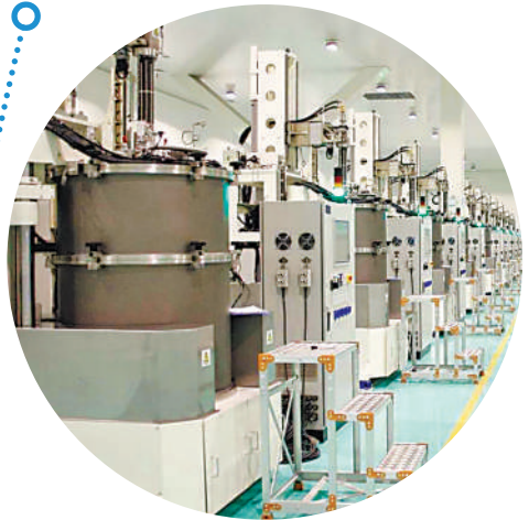
宁夏启玉生物新材料有限公司生产车间。