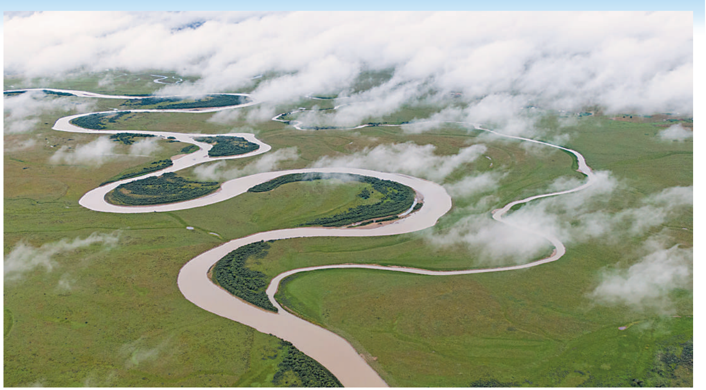
俯瞰黄河若尔盖县唐克镇段一角(2022年8月15日摄,无人机照片)。 四川若尔盖湿地国家级自然保护区,位于四川省阿坝藏族羌族自治州若尔盖县境内,是以高寒泥炭沼泽生态系统和黑颈鹤等珍稀物种为主要保护对象的自然保护区。该保护区于1998年成为国家级自然保护区,于2008年列入“国际重要湿地”名录。 四川若尔盖湿地国家级自然保护区里,九曲回流的河流、星星点点的湖泊和沼泽点缀在辽阔的草原之上,四季景色壮美。近些年,当地政府践行黄河流域生态保护与高质量发展要求,统筹推进生态保护与民生发展,采取护湿还水、禁牧还草、防沙治沙等生态修复治理措施,保护区生态环境不断向好。

新华社武汉/日内瓦11月3日电 长江之滨武汉,国际会议之都日内瓦,《湿地公约》第十四届缔约方大会3日在两地举行跨国连线新闻发布会。国家林业和草原局国际司副司长胡元辉介绍,此次大会期间,《湿地公约》秘书处将向25个新晋“国际湿地城市”颁发证书,届时全世界43个“国际湿地城市”中,中国占据13个,数量居各国第一。 “这是城市湿地生态保护的最高成就。”他说。此次,中国合肥、济宁、重庆梁平、南昌、盘锦、武汉、盐城被列为第二批“国际湿地城市”。2018年,哈尔滨、海口、银川、常德、常熟、东营是首批获此殊荣的中国城市。 《湿地公约》是致力于湿地生态系统保护和合理利用的政府间协定,首次于1971年2月在伊朗拉姆萨尔签署。目前,缔约方已发展到172个。由公约认证的“国际湿地城市”让更多地方采取更加积极的行动保护生态、实现可持续发展。 中国政府1992年加入《湿地公约》,积极履行公约义务。特别是近10年来,中国秉持生态文明和绿色发展理念,大力保护修复湿地生态和水环境,充分展现负责任生态大国形象。 国家林草局最新调查结果显示,2012年至今,中国新增和修复湿地80余万公顷,目前拥有国际重要湿地64处,国家重要湿地29处,省级重要湿地1021处。