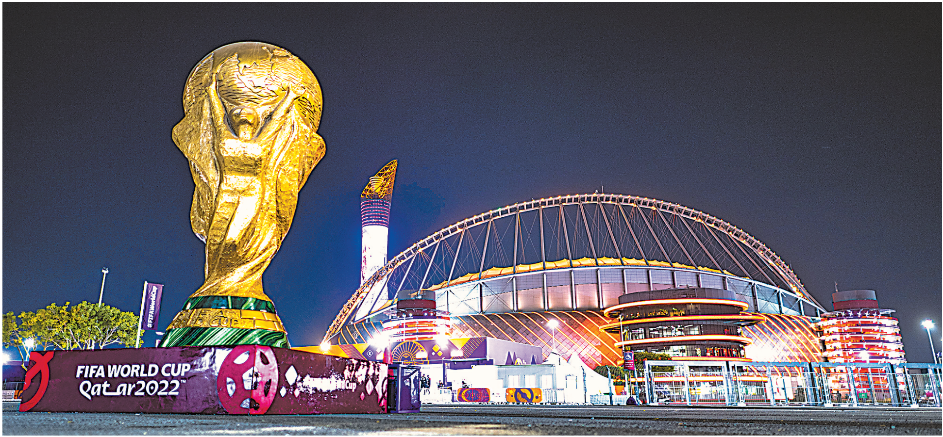
这是11月17日拍摄的哈利法国际体育场。2022年卡塔尔世界杯将于11月20日开幕,八座比赛球场已准备就绪。据悉,开幕式预计时长为30分钟,除了有卡塔尔本土艺人带来充满海湾风情的表演,还将邀请到五大洲知名歌手现场演唱本届世界杯的官方主题曲与多支推广歌曲。