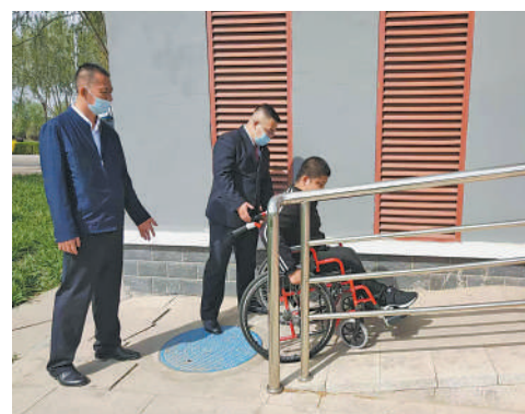
灵武市人民检察院联合相关部门实地走访调研公共场所无障碍环境建设情况。