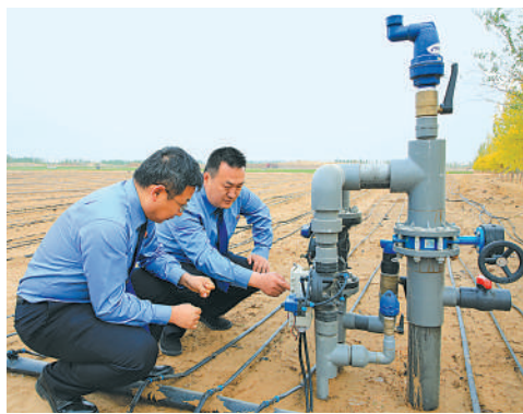
平罗县人民检察院对辖区自备井非法取用黄河水问题展开调查。

5年来,全区检察机关立案办理的公益诉讼案件中,涉生态环境和资源保护领域案件3352件,占比达到60.2%。其中,涉及生态环境损害赔偿金的民事公益诉讼案件63件,被诉侵权人缴纳、执行生态环境损害赔偿金1102.78万元。