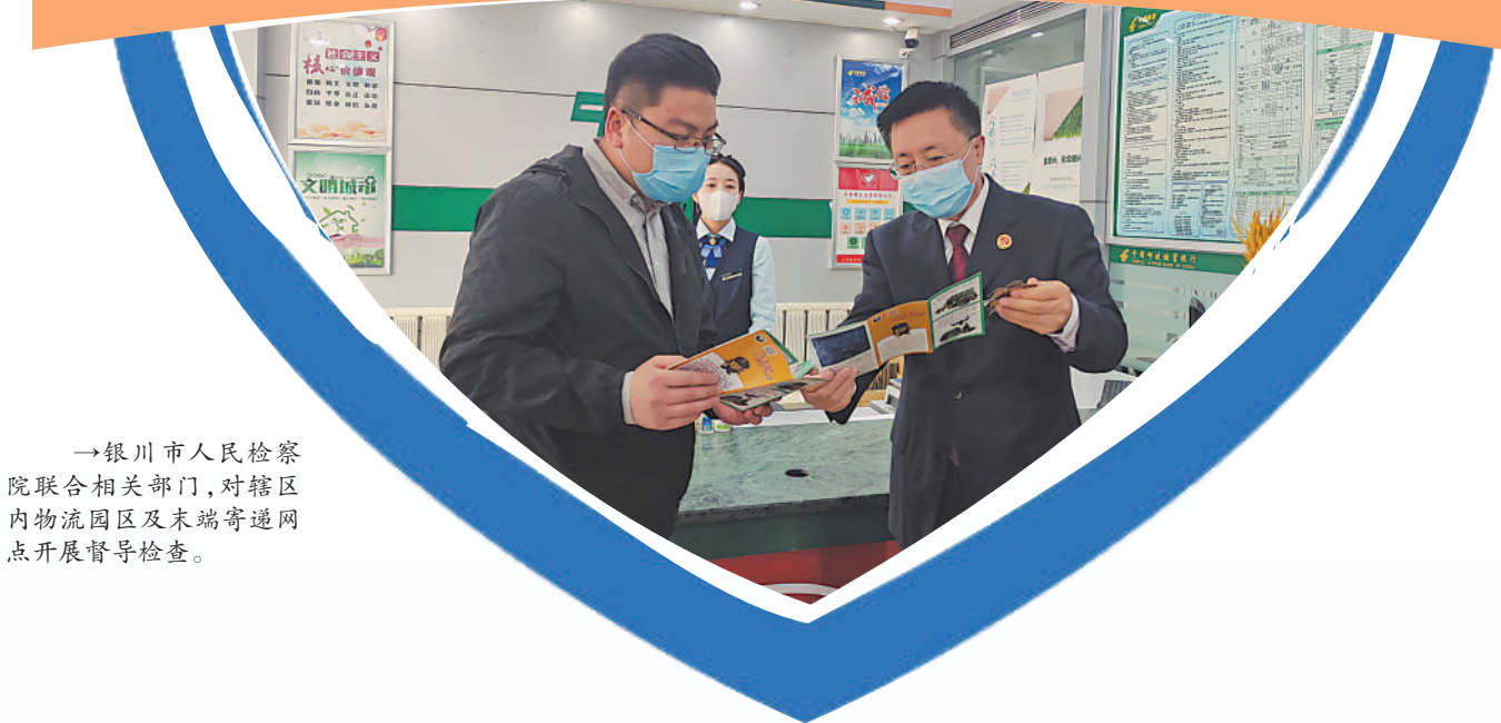
→银川市人民检察院联合相关部门,对辖区内物流园区及末端寄递网点开展督导检查。