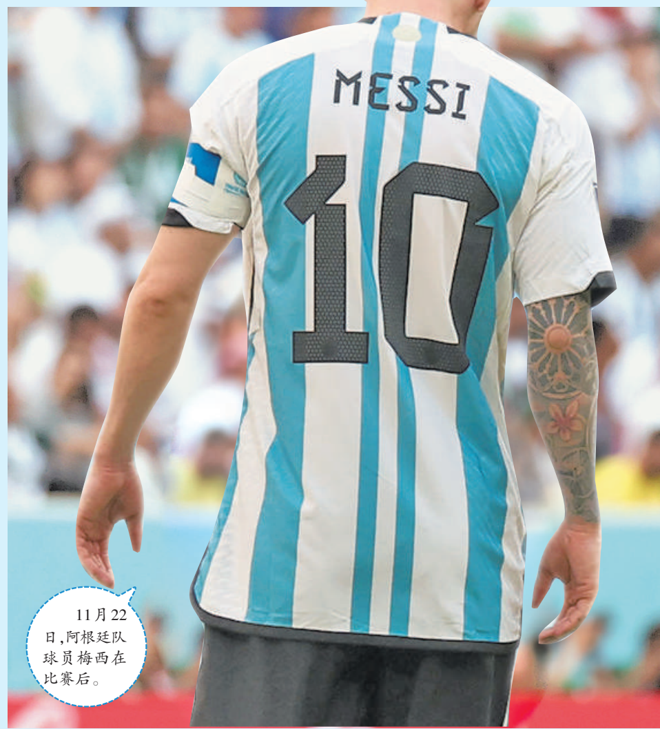
11月22日,阿根廷队球员梅西在比赛后。