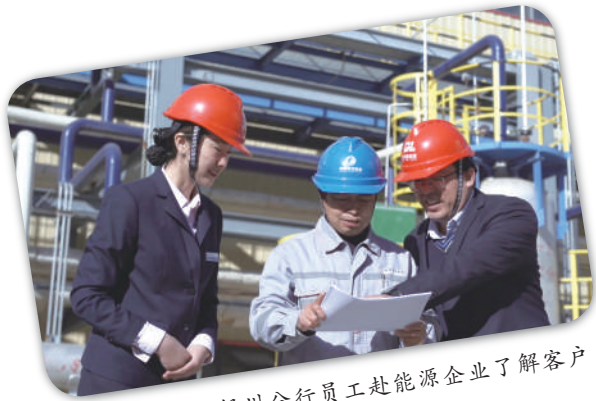
兴业银行银川分行员工赴能源企业了解客户需求。

银川分行立足闽宁协作,主动充当闽宁金融合作桥梁纽带,不断扩大闽宁基础金融服务覆盖面,探索和实践从体制机制、产品创新、特色服务等全方位助力宁夏产业稳步发展。截至目前,重点产业贷款占对公贷款比例超过60%,制造业贷款占对公贷款比例超过40%。