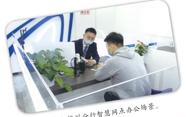
兴业银行银川分行智慧网点办公场景。

宏伟蓝图鼓舞人心,壮阔征程催人奋进。兴业银行银川分行将充分发挥闽宁金融协作主力军作用,以更大的担当、更足的干劲,更实的举措,助力宁夏经济高质量发展迈上新台阶。(巫天晓)