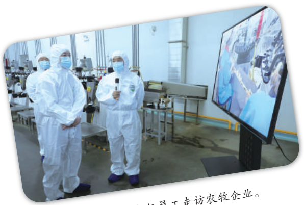
兴业银行银川分行员工走访农牧企业。

科技兴则民族兴,抓创新就是抓发展。金融业随着科技发展尤其是数字技术发展,将逐渐发生深层次变革。银川分行在总行的“科技兴行”战略指引下,积极发挥自身综合经营优势,以数据、技术双要素为驱动,加速业务模式及管理模式创新,在渠道建设、线上信贷、数据应用等领域积极实践,不断提升金融服务质效。