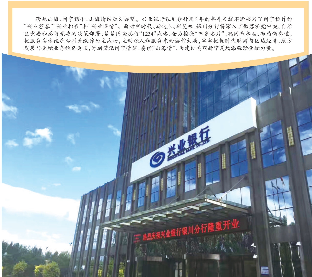
兴业银行银川分行办公大楼。

如何借助科技力量,提升服务质效,打破企业“融资难、融资贵”的发展桎梏,一直是银川分行重点探索的方向。银川分行持续加大线上业务产品推广应用,积极打造金融服务专区,搭载“快易贷”“快押贷”“合同贷”“快捷保函”等业务为企业提供线上融资服务。协助宁夏金融监管局开发“宁夏企业融资服务平台”,通过“兴业普惠”和“宁夏企业融资服务平台”的数据对接,实现资金供需双方线上高效对接。目前,已入驻平台的金融机构达53家,注册企业近2000家,共解决逾29亿元企业融资需求。