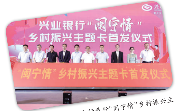
兴业银行银川分行举行“闽宁情”乡村振兴主题卡首发仪式。

去年以来,银川分行多次深入定点帮扶同心县河西镇李沿子村的帮扶车间和村集体产业养殖园区,对村情村貌及产业经济发展进行了深层次调研。积极参与该