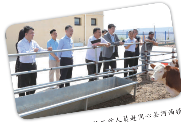
兴业银行银川分行工作人员赴同心县河西镇李沿子村调研。

民族要复兴,乡村必振兴。近年来,银川分行主动融入乡村振兴发展战略,探索具有兴业特色的金融服务模式,助力解决“三农”急难愁盼问题,取得了积极成效。