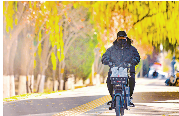
银川迎来降温天气

光明社区充分发挥党组织在社区治理中的引领作用,推行“一征三议两公开”制度,在小区、网格内打造“红色文化广场”