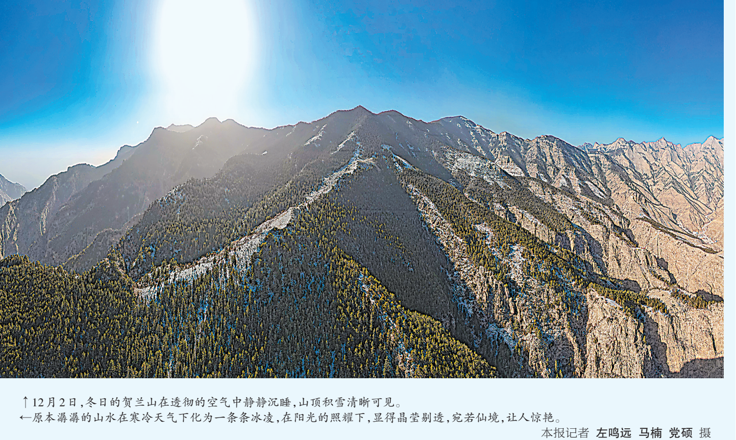
↑12月2日，冬日的贺兰山在透彻的空气中静静沉睡，山顶积雪清晰可见。 ←原本潺潺的山水在寒冷天气下化为一条条冰凌，在阳光的照耀下，显得晶莹剔透，宛若仙境，让人惊艳。