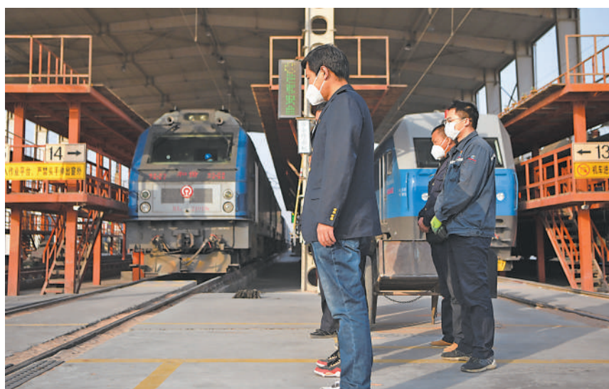
在中国铁路兰州局集团有限公司兰州西机务段东整备车间,机车鸣笛,干部职工肃立默哀。