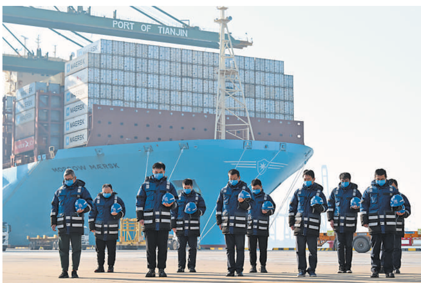
在天津港太平洋国际集装箱码头,职工肃立默哀。