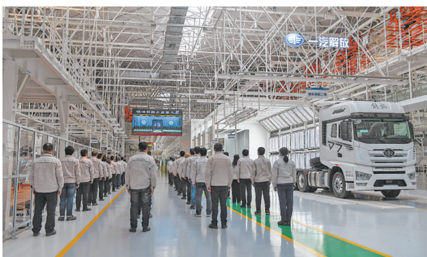
在吉林长春的一汽解放工厂车间,工人们收看江泽民同志追悼大会直播。

全党全军全国各族人民,为失去了江泽民同志这样一位伟大人物感到无限悲痛,世界各国人民、各国领导人和各方面国际友人也表示深切哀悼。