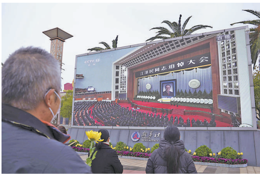
在江西南昌八一广场,群众收看江泽民同志追悼大会直播。

江泽民同志逝世后,台湾各界人士以不同形式对江泽民先生逝世表达哀悼。在大陆各地的台湾同胞,也纷纷表达哀悼与追思。