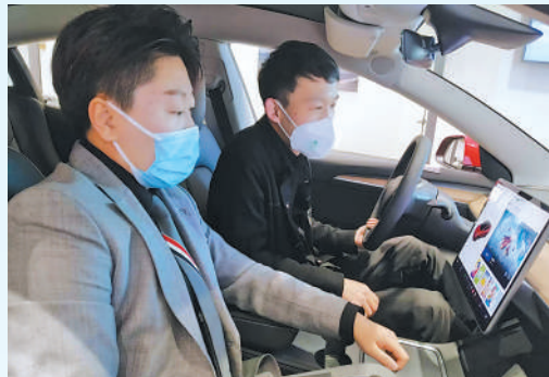
消费者在选购新能源汽车。