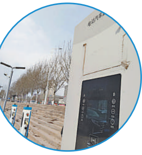
新能源汽车充电桩。

根据财政部、工业和信息化部、科技部和发展改革委下发的《关于完善新能源汽车推广应用财政补贴政策的通知》,新能源汽车购置补贴政策将于12月31日终止,在此之后上牌的车辆国家将不再给予补贴。“国补”退场对宁夏新能源汽车的销售将产生哪些影响?地方助推政策将会发生哪些变化?离12月31日只剩10余天时间,消费者是否需要赶政策的“末班车”?针对大家关心的问题,记者进行了深入采访。