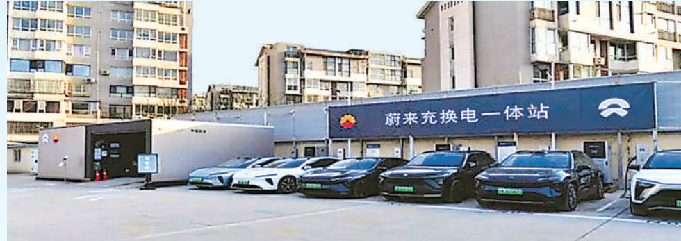
银川市某商场里的新能源汽车充电桩。