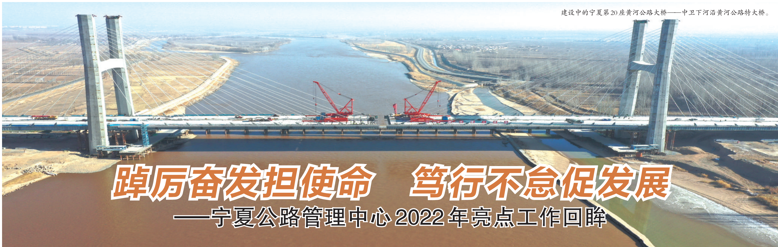
建设中的宁夏第20座黄河公路大桥——中卫下河沿黄河公路特大桥。