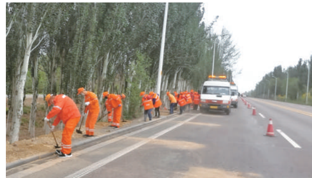
全区普通国省干线公路路容路貌焕然一新。