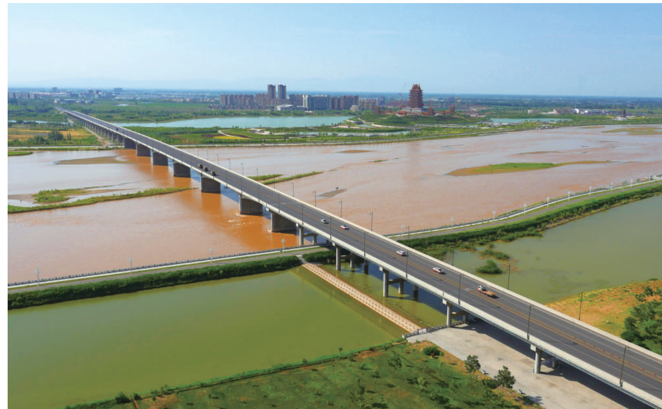
做好“建养一体化”改革“后半篇文章”,以全新的理念推动全区公路管理事业高质量发展。