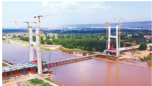
用实干铸就事业梦想。