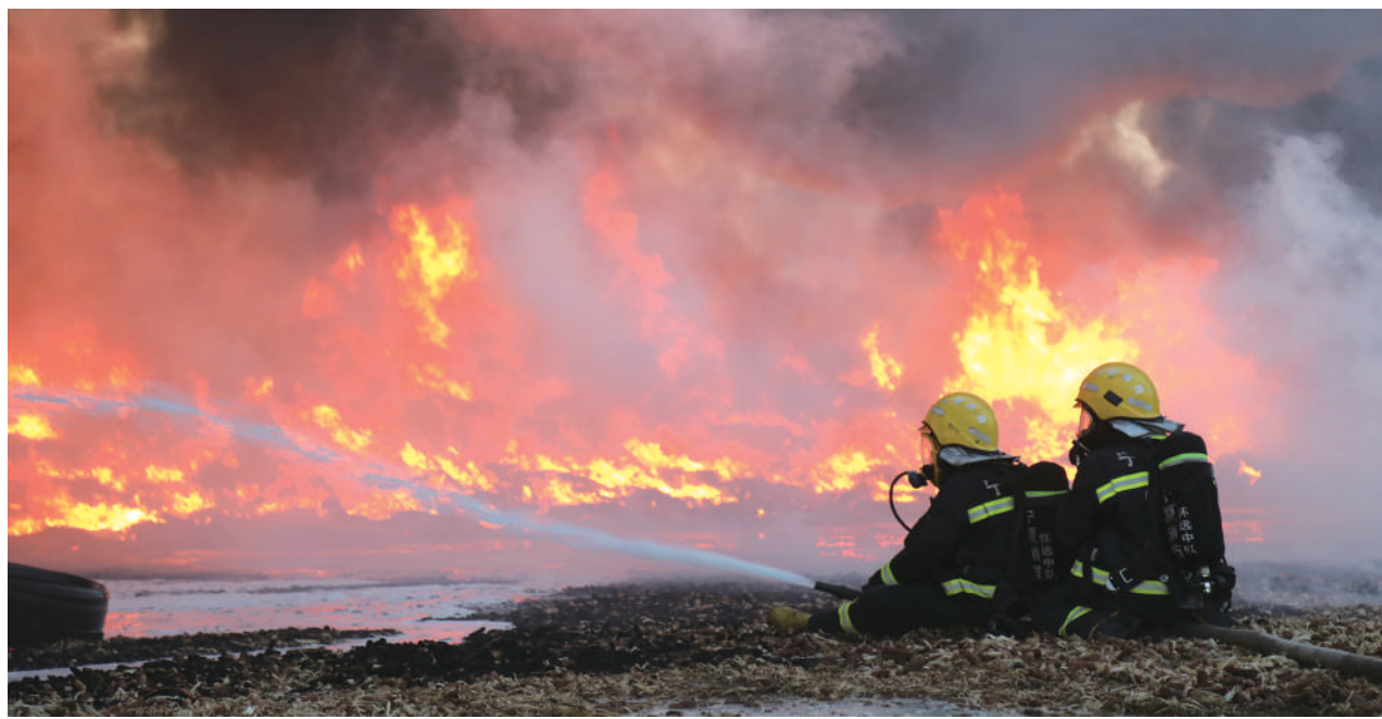
消防救援人员正在进行火灾扑救。