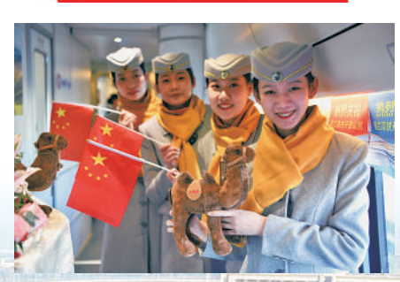
乘务员在首发列车车厢里合影留念