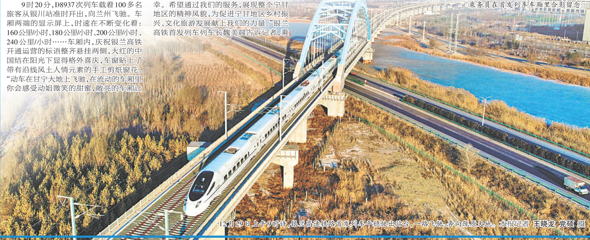
12月29日上午9时许,银兰高速铁路首发列车平稳驶出站台,一路飞驰,奔向陇原大地。本报记者 王晓龙 党硕 摄

锚定目标任务 持续加压奋进 ——三论学习贯彻自治区党委十三届三次全会暨党委经济工作会议精神 本报评论员 乘钢而目自张,执本而末自从。自治区党委十三届三次全会暨党委经济工作会议对2023年全区工作提出了总体要求,明确了发展目标。深入学习贯彻会议精神,就要按照会议要求,突出重点工作、扭住关键环节,锚定目标任务、持续加压奋进,切实抓好明年经济社会发展各项任务。 在中央经济工作会议上,习近平总书记强调:“明年经济工作千头万绪,要从战略全局出发,抓主要矛盾,从改善社会心理预期、提振发展信心入手,抓住重大关键环节,纲举目张做好工作。”面对纷繁复杂的形势和任务,我们只有从全局出发,始终坚持“两点论”和“重点论”相统一,做到对各种矛盾心中有数,同时又能优先解决主要矛盾和矛盾的主要方面,才能以解决主要矛盾带动其他矛盾的解决,以完成关键环节任务促进各项任务全面完成。 回首今年一年,虽然外部环境始终严峻复杂、发展安全任务艰巨繁重,但全区各地各部门紧盯全年目标,坚决打好“七大战役”,大力推动“六新六特六优”产业高质量发展,全面落实稳经济、保增长、促发展一系列政策措施,全区经济运行保持总体平稳、稳中有进的良好态势,主要经济指标位居全国“第一方阵”。事实证明,抓住关键环节不放手,锚定目标任务不放松,始终保持战略清醒和战略主动,正视问题、迎难而上、团结奋斗、负重拼搏,我们就能战胜发展中的各种艰难险阻,推动高质量发展稳步前进。 中流击水当奋楫,行至半山勇登攀。明年工作千头万绪,形势更为复杂,任务更为艰巨。一方面,国际环境更趋复杂多变,国内需求收缩、供给冲击、预期转弱“三重压力”仍然较大,改革发展稳定的任务重、挑战多、压力大;另一方面,中国经济韧性强、潜力大、活力足,长期向好的基本面没有变,支撑我区明年发展的有利条件也越来越多。当此有利因素和不利因素叠加、机遇与挑战交织的紧要关头,更加需要我们清醒、准确、科学把握当前的“时与势”,把思想和行动统一到党中央和自治区对明年工作的决策部署上来,更加需要我们紧扣现代化建设大局、高质量发展主题,抓住主要矛盾和关键环节,纲举目张、以点带面做好各项工作,以“跳起来摘桃子”的劲头抢抓机遇,打起十二分的精神狠抓落实,推动宁夏在中国式现代化建设的赛道上不断跑出好成绩。(下转第三版)