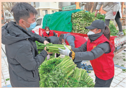
社区为居民免费分发蔬菜。