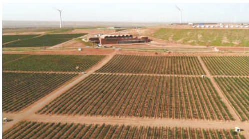
青铜峡市鸽子山片区崛起葡萄酒产业新高地。