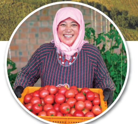
连湖西红柿喜获丰收。

始终坚持把维护社会稳定作为第一责任,加快治理体系和治理能力现代化建设。强化矛盾纠纷排查化解,全市初信初访按期办结率达95.3%。建成全区首家反诈暨打击整治养老诈骗宣教基地,全年电信诈骗发案数、财损数降幅达44.3%和41.3%。全面推行安全生产“红黄牌警告”“三色管理”制度,安全生产形势保持稳定。深化基层治理,南苑社区“党建+网格+积分”治理经验在全区交流推广。禁毒宣传项目获中国青年志愿服务大赛金奖,青铜峡镇被评为自治区国家安全示范镇。顺利通过全国双拥模范城中期评估。紧扣铸牢中华民族共同体意识这条主线,累计创建吴忠市级以上示范点76个,本级示范点创建率达95%,被评为全国民族团结进步创建活动示范市。