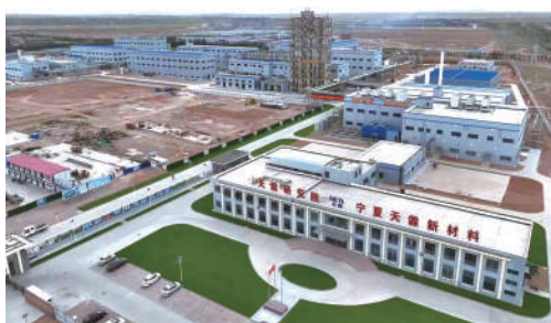
宁夏天霖新材料科技有限公司——打造精品项目填补区内空白。

来首次实现两位数增长,规模以上工业增加值增长12%左右,制造业等实体经济增加值占比逾70%。一般公共预算收入增长4%,固定资产投资增长10%左右,城镇居民和农村居民人均可支配收入分别增长7%和9%左右。开工建设牛首山抽水蓄能电站入场道路、永利新材料等基本建设项目160个,产业类项目占比高达70%。围绕构建“5+5+N”现代产业体系,成功签约天新药业等亿元以上大项目8个,落实到位资金85.6亿元。奶牛、生猪等畜禽养殖扩量增效,酿酒葡萄突破15万亩,种植面积稳居全区第一,销售额达到3.9亿元。创成国家全域旅游示范区,全年接待游客250万人次,实现旅游综合收入13.8亿元。