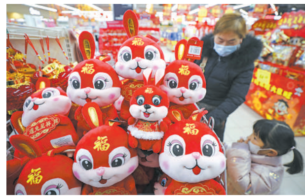
1月10日,江苏淮安市民在超市挑选生肖兔玩具。春节临近,人们以各种形式喜迎佳节,城市乡村年味渐浓。

他表示,中方再次呼吁相关国家从事实出发,科学适度制定防疫措施,不应借机搞政治操演,不应有歧视性做法,不应影响国家间正常的人员交往和交流合作。