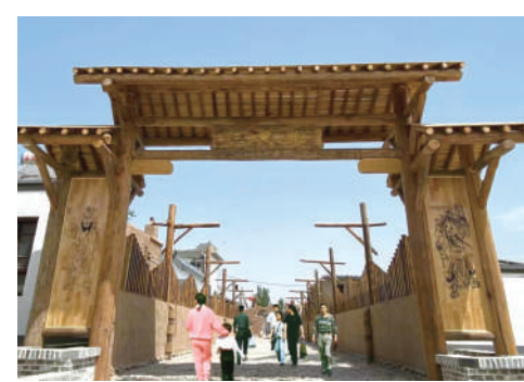
汉唐古渠第一村——大坝镇韦桥村乡村旅游风生水起。