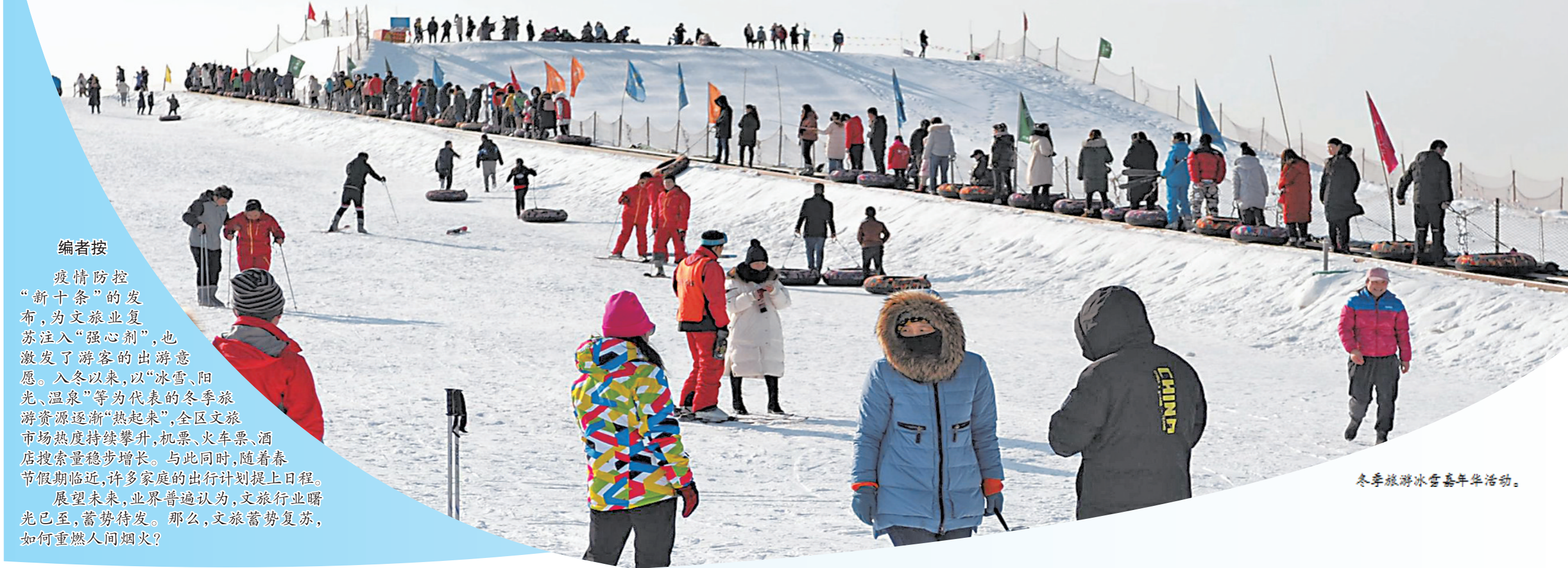
冬季旅游冰雪嘉年华活动。

编者按 疫情防控“新十条”的发布，为文旅业复苏注入“强心剂”，也激发了游客的出游意愿。入冬以来，以“冰雪、阳光、温泉”等为代表的冬季旅游资源逐渐“热起来”，全区文旅市场热度持续攀升，机票、火车票、酒店搜索量稳步增长。与此同时，随着春节假期临近，许多家庭的出行计划提上日程。展望未来，业界普遍认为，文旅行业曙光已至，蓄势待发。那么，文旅蓄势复苏，如何重燃人间烟火？