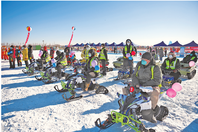
2022年宁夏冬季文化旅游节开幕现场。

客享受高品质的冬季旅游产品，增强获得感和幸福感。但是，冬季旅游市场暴露出的产品雷同、业态单一、旅游资源利用率低等问题依然比较突出，冬季旅游如何“热”一把？ 笔者认为，冬季旅游发展要改变“冬季是淡季”的固化思维，做大做强优势，叫响品牌。开发集温泉、疗养、运动、休闲为一体的旅游区，发展以温室设施为载体的全时休闲度假产品，建设开发一批适合冬季