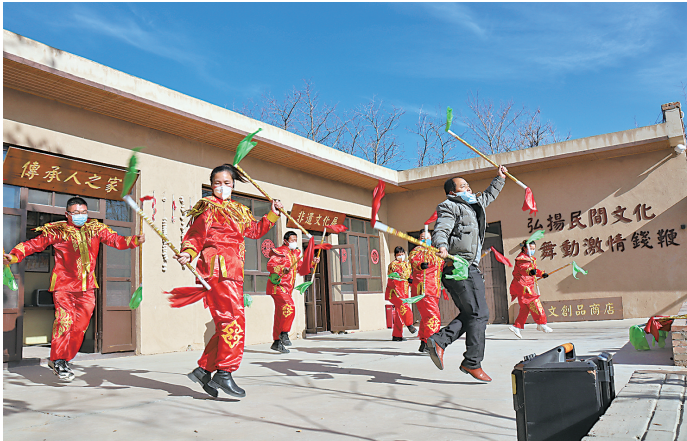
黄羊钱鞭舞非遗文化体验。