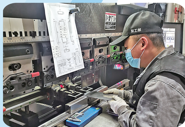
宁夏小牛自动化设备股份有限公司操作工人在作业。

本报讯(见习记者 张敏)订单需求相比往年增长明显,春节前的订单还没完成,节后又接到许多新订单……1月30日,记者走访得知,银川众多企业在春节假期结束后迅速进入全力生产状态,有的企业员工到岗率已达100%,全心投入到2023年的工作中。 “目前上半年的订单已经满了,这些订单主要来自江苏、浙江等地,预计每月产值达9000万元,一季度销售额预计完成5亿元,今年将聚焦光伏设备研发新产品。”宁夏小牛自动化设备股份有限公司副总经理周海介绍。 作为西北唯一的光伏组件设备制造企业,宁夏小牛自动化设备股份有限公司生产的太阳能电池片全自动串焊机、太阳能电池串与汇流带焊接机,不仅打破了光伏串焊机依赖进口的局面,而且在焊接质量、产能、焊接方式、搬运方式等关键指标上都达到了国内领先水平。