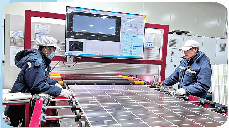
宁夏金晶科技有限公司员工对产品进行质量检查。

本报讯(见习记者 蔡堯郁)春节假期刚过,石嘴山市各企业陆续开工,恢复生产。1月28日,记者走进宁夏苏宁新能源设备有限公司再制造车间,只见整齐干净的车间里,自动化的机械设备按照设定好的程序运行着,工作人员以饱满的工作热情在各自的岗位上认真工作。“我们车间今天已全员到岗,开始正式生产了。”该公司车间主任郑元峰说。 宁夏苏宁新能源设备有限公司是一家集铸造、制造加工、再制造生产煤机装备零部件的研、产、销为一体的高