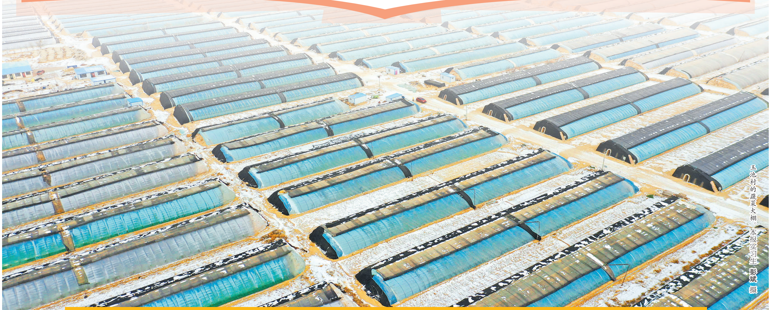
玉池村的蔬菜大棚。

新的“出路”故事,仍被红寺堡人继续演绎着,也被马慧娟观察记录着,成为她的第一手写作素材。相信在不久的将来,这些移民们的新时代美好生活又会跃然纸上,为广大读者所熟知。