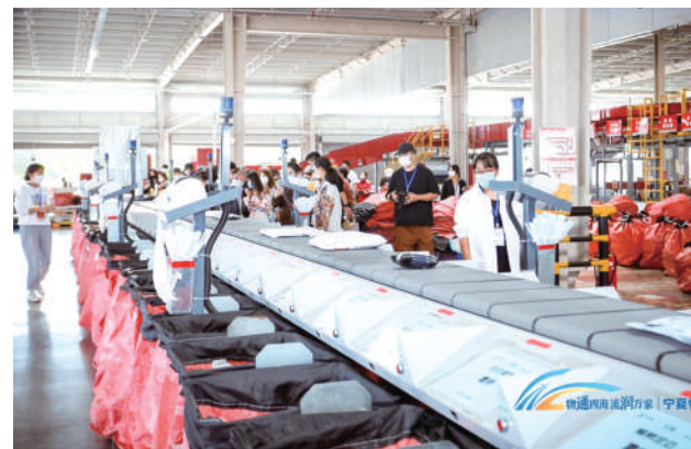
2022年9月,“物通四海 流润万家”宁夏物流节分项活动之一“生活鲜选择”百名市民走进物流日活动。

乘势而上,御风而行。我区现代物流体系建设必将抓住新的机遇,迈开新步伐,展现新作为。