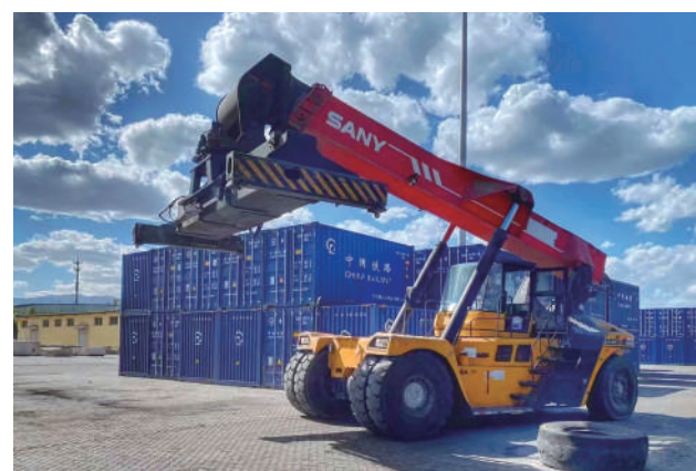
银川中外运陆港物流有限公司园区内,集装箱正面吊正在作业。