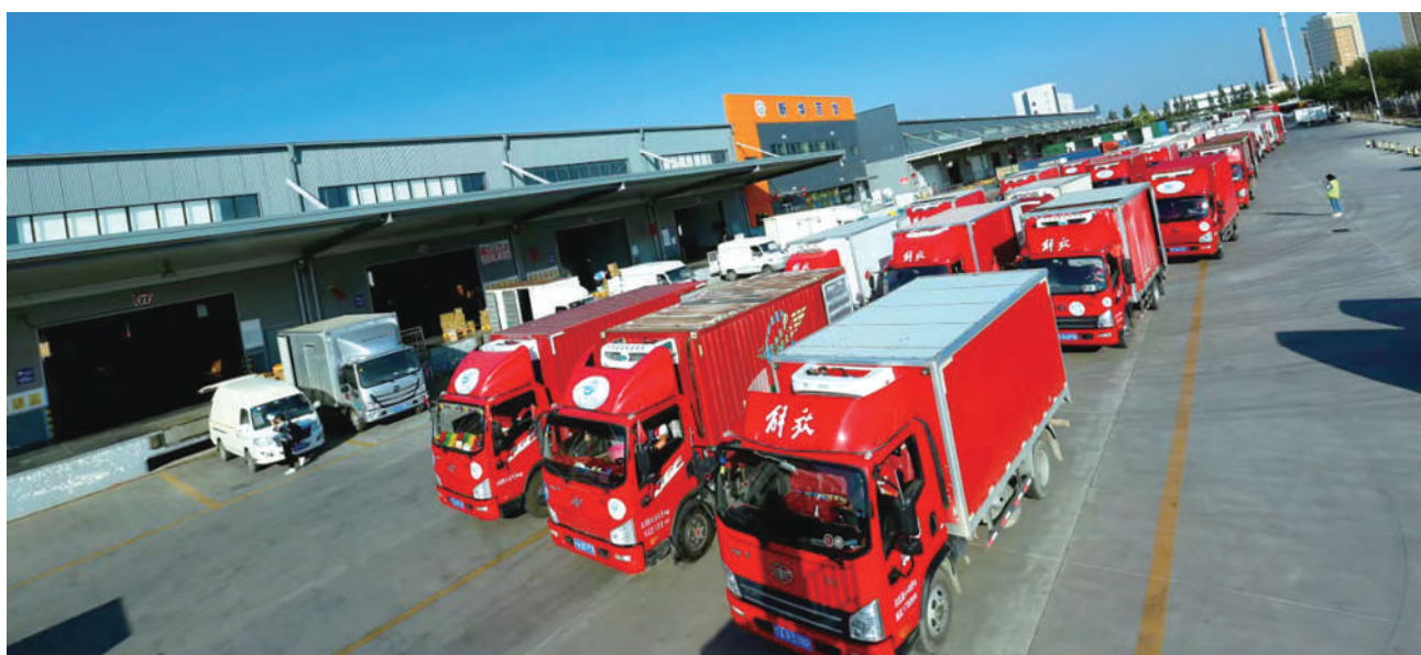
新华百货现代物流园。