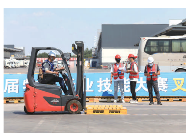
宁夏首届物流行业技能大赛叉车比赛现场。