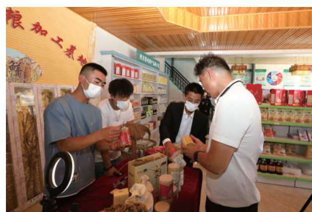
全区农村寄递物流体系建设现场会与参会人员在西吉县观摩。