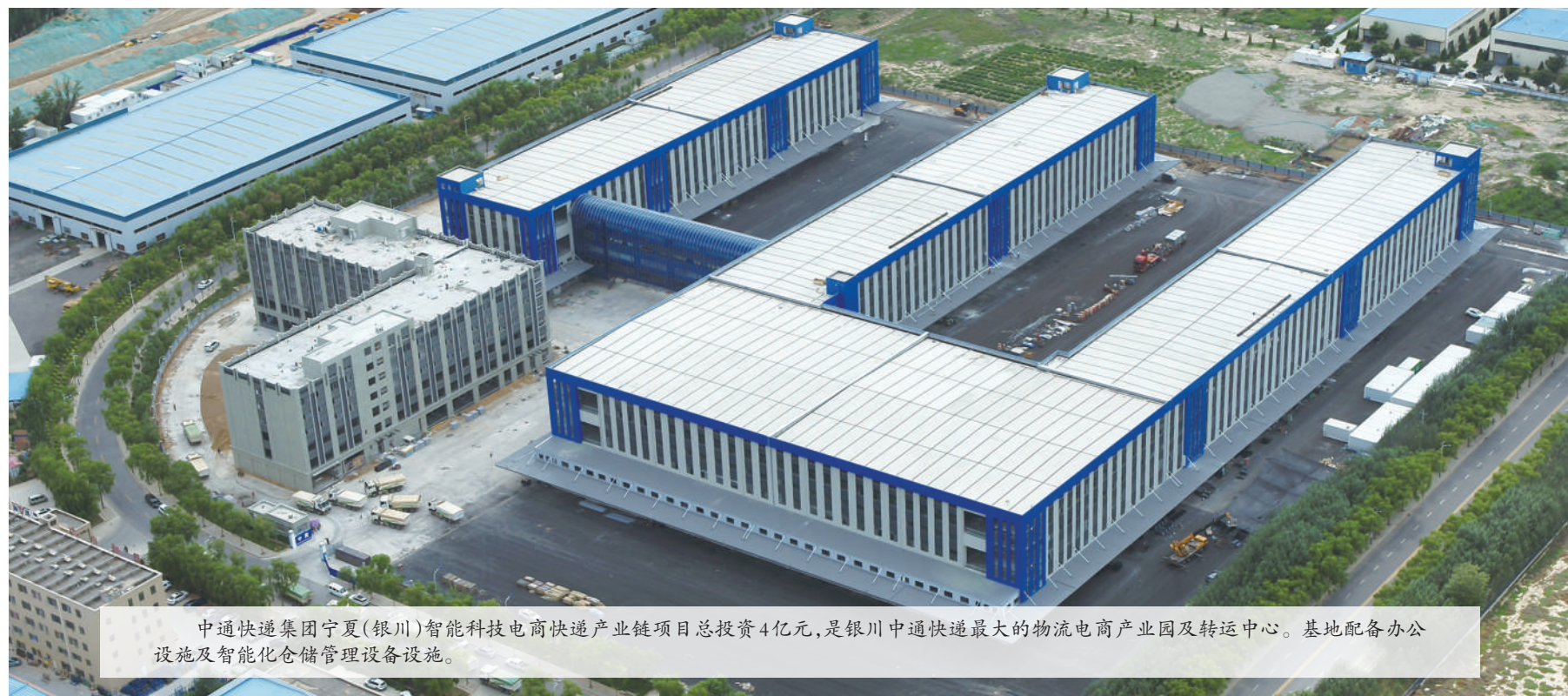
中通快递集团宁夏(银川)智能科技电商快递产业链项目总投资4亿元,是银川中通快递最大的物流电商产业园及转运中心。基地配备办公设施及智能化仓储管理设备设施。

数据见证行业发展成效。高增速的背后,是我区不断加大结构转型力度,聚力现代物流业提质增效的成果。2022年我区争创商贸服务型国家物流枢纽,大力推进“公转铁”,推动冷链物流、城乡配送和农村寄递物流提升质效,强化供应链创新发展,推动物流企业现代化转型,通过扩大对内对外开放,拉动有效需求,增加供给能力,促进全区物流业的快速增长。全区物流运行呈现趋势向好、动能提升的良好态势,为新冠疫情防控、民生保障、经济发展提供了有力支撑。