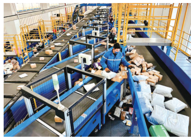
中通快递宁夏管理中心日处理快递量约50万件。