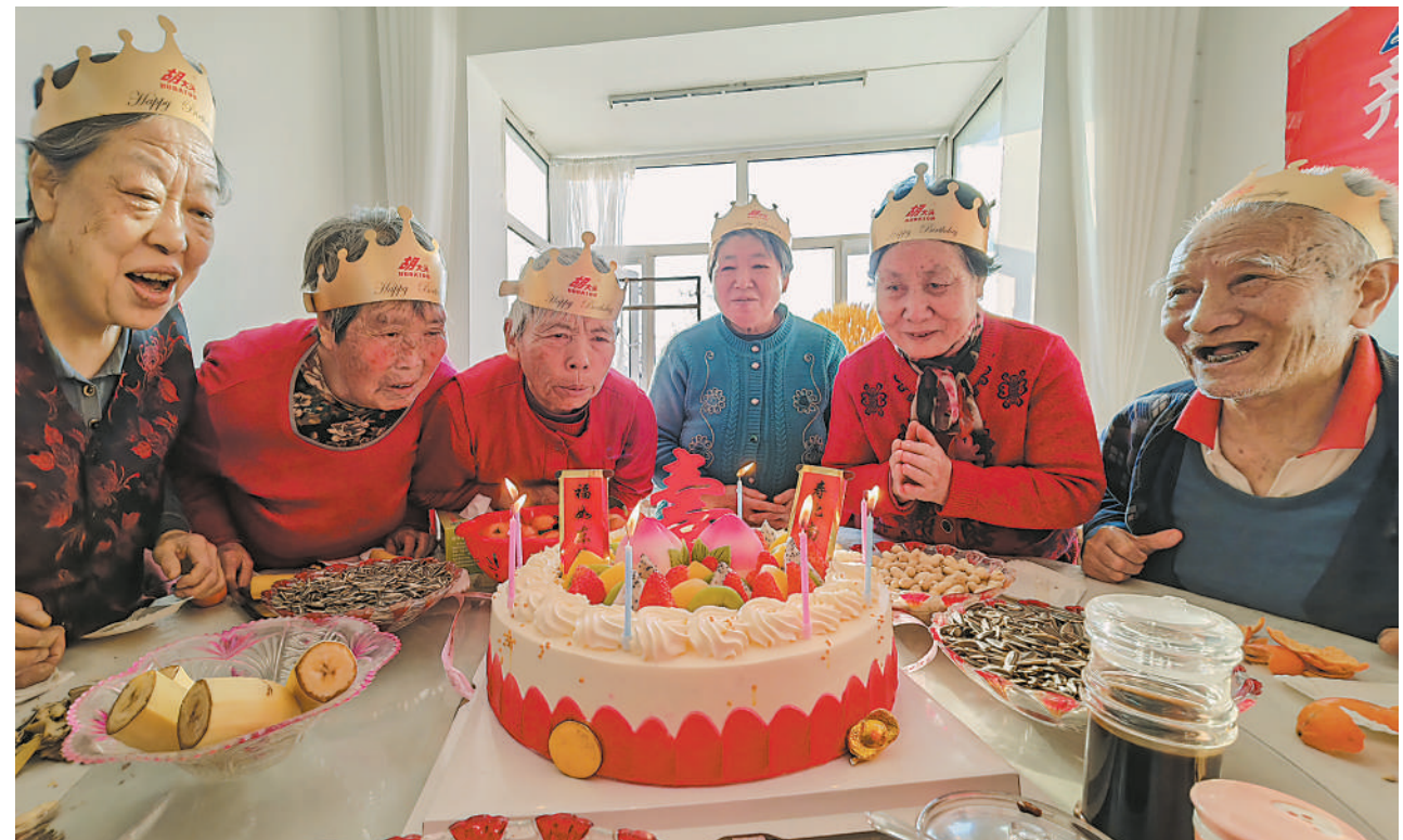
2月22日,银川市西夏区怀远路街道赛马社区为本月出生的29名65岁以上所辖社区老人举办集体生日。从今年2月开始,赛马社区将每月选择一天为当月出生的所辖社区老人过集体生日,这是该社区关爱、服务老人的又一暖心举措。

工程,更新补充抢险物资,落实抢险队伍,做好抢险基础保障。凌汛期,有关工作人员24小时值班值守,密切监视凌情发展变化,发送凌情监测预报信息10万余条,为防凌工作提供信息支撑。青铜峡、沙坡头水库按照“发电、供水服从防凌”的总体要求,严格控制下泄流量,为平稳封、开河创造了有利条件。