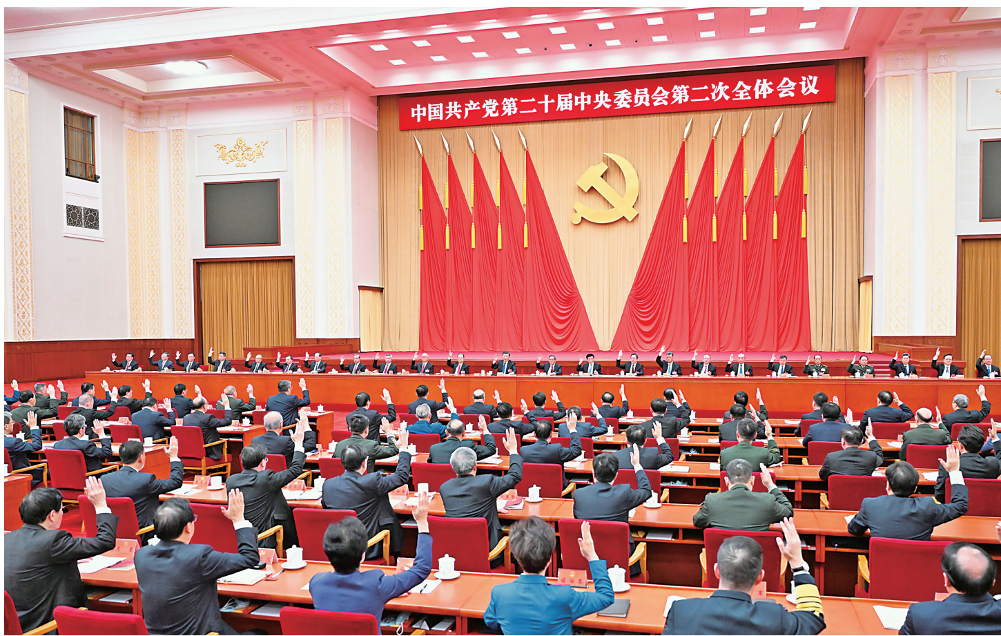
中国共产党第二十届中央委员会第二次全体会议,于2023年2月26日至28日在北京举行。中央政治局主持会议。