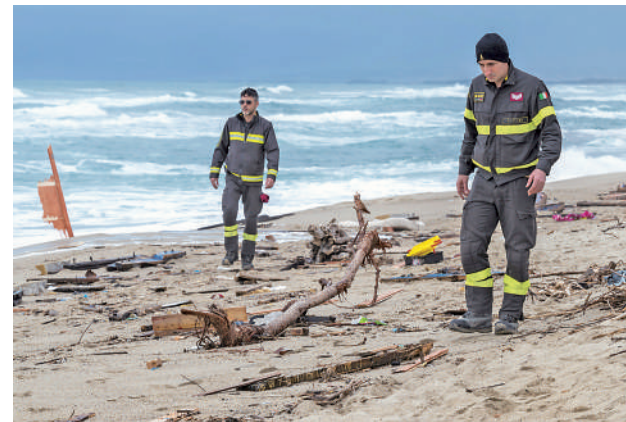
2月27日,救援人员在意大利南部库特罗附近海边查看移民船残骸。据意大利媒体报道,截至27日晚间,日前在意大利南部海域发生的移民船沉没事故死亡人数上升至63人,另有81人幸存,数十人失踪,搜救工作仍在继续。

争端解决机制是世贸组织的重要支柱。自成立以来,世贸组织的争端解决机构共受理了成员间近600宗贸易争端,维护了国际贸易环境的稳定性和可预见性。2019年12月,因美国阻挠上诉机构新法官遴选,作为全球贸易“最高法院”的上诉机构因缺员正式停摆,世贸组织争端解决功能也因此部分瘫痪。