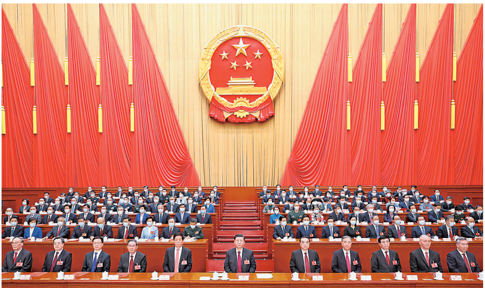
3月13日,第十四届全国人民代表大会第一次会议在北京人民大会堂闭幕。习近平等党和国家领导人在主席台就座。

新华社北京3月13日电 中华人民共和国第十四届全国人民代表大会第一次会议,在圆满完成各项议程,产生新一届国家机构组成人员后,13日上午在北京人民大会堂闭幕。