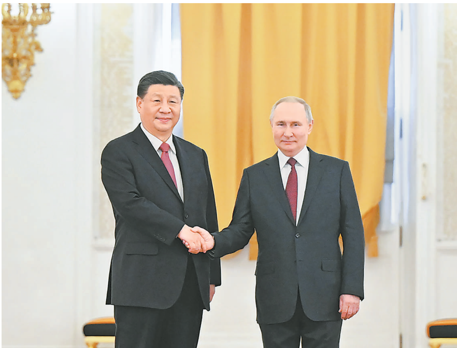
当地时间3月21日下午，国家主席习近平在莫斯科克里姆林宫同俄罗斯总统普京举行会谈。普京在乔治大厅为习近平举行隆重欢迎仪式。这是两国元首紧紧握手，合影留念。

于各领域合作情况汇报。 习近平指出，在双方共同努力下，两国政治互信、利益交融、民心相通不断深化，经贸、投资、能源、人文、地方等领域合作持续推进，合作领域不断扩大，共识进一步加强。今年是中国全面贯彻落实中共二十大精神的开局