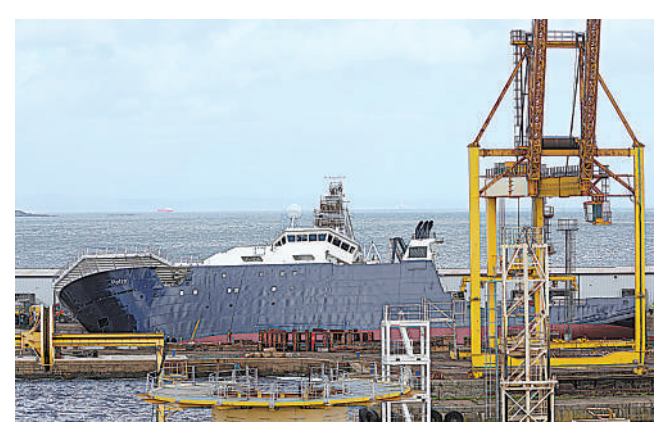
这是3月22日在英国苏格兰首府爱丁堡北部利斯顿“帝国码头”拍摄的歪斜的研究船。一艘系泊于英国苏格兰首府爱丁堡北部利斯顿“帝国码头”码头内的大型研究考察船22日突然歪斜,导致30多人受伤。据分析,这一事故或由大风造成。

联储借款额创历史新高。美联储数据显示,截至15日的一周,银行从美联储借款总额达1528.5亿美元,远高于前一周的45.8亿美元和2008年金融危机期间1110亿美元的单周峰值。同时,自美联储12日宣布新的银行定期融资计划后,符合条件的储蓄机构3天内通过该计划贷款高达约119亿美元。 纽约联储前高管、资产管理公司PGIM固定收益公司首席全球经济学家达利普·辛格认为,美国正面临一场“规模庞大的信贷紧缩”。 知名美联储观察家、萨桑·加赫拉马尼宏观经济咨询公司首席经济学家蒂姆·杜伊在一份报告中写道,美联储面临政策风险。如果在美联储加息的同时银行关闭数量成倍增加,那么“政治后果将非常严重”。 (新华社华盛顿3月22日电)