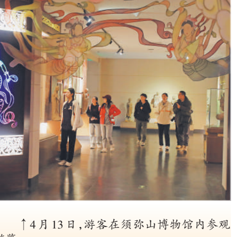
↑4月13日,游客在须弥山博物馆内参观游览。

←4月13日,游客在固原市古雁岭城市森林公园内参观游玩。今年,固原市通过举办特色文旅活动、发放惠民文旅消费券、举行文旅产业招商项目推介会、挖掘消费新亮点等方式,文旅消费市场强劲复苏,1—3月共接待游客355.42万人次,同比上升678.46%;营业收入6948.61万元,同比上升818.42%。