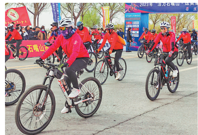
4月15日,2023年“活力石嘴山 炫美星海湖”环星海湖山地自行车公开赛鸣枪开赛。比赛分为男子山地青年组、男子山地中年组、男子山地大师组、女子山地组和荣誉骑行组5个组别。

今年截至目前,国网宁夏电力有限公司已为全区0.67万户企业用户节省办电投资1.36亿元;实现居民“刷脸办电”、“企业一证办电”、“房产+电力”联合过户所有市县全覆盖;已走访各类企业用户0.9万户,收集各类诉求400余条,正逐一解决答复。