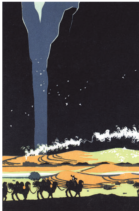
塞北春晓(套色木刻)