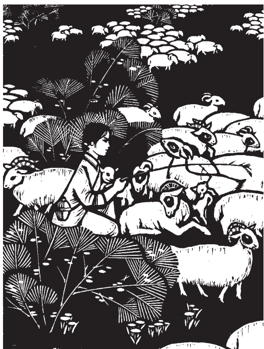
羊群点白绿草滩(木刻)