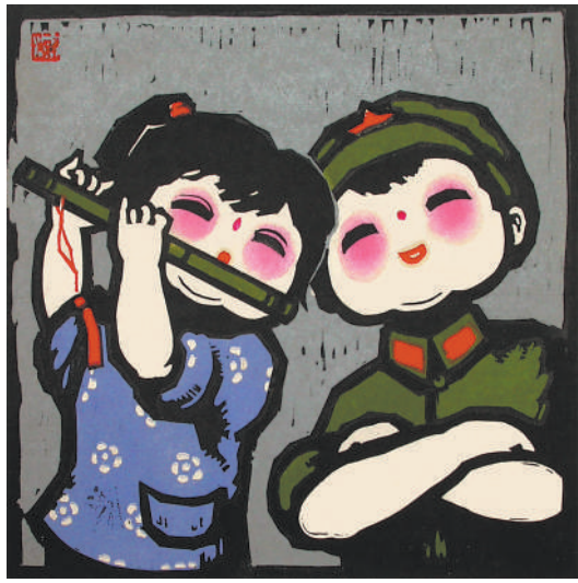
我是一个兵(水印木刻)