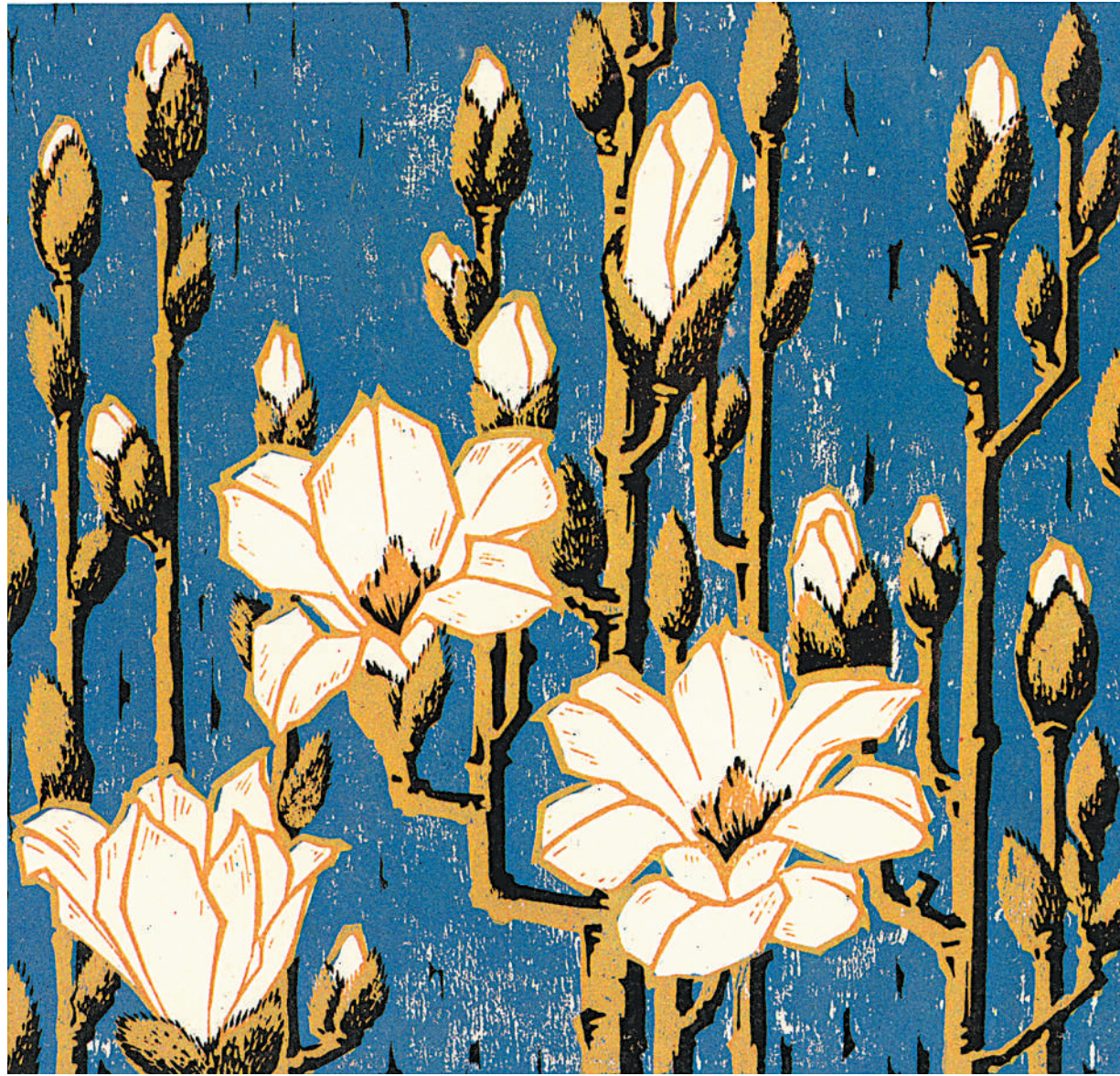
亭亭玉立(套色木刻)