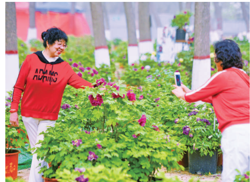
4月19日,市民与身边怒放的牡丹花合影留念。近日,银川市中山公园举办第三届洛阳牡丹文化节,各色牡丹花娇艳欲滴,吸引了众多市民前去观赏。

“首批推出涉及餐饮、超市、便利店、零售药店等14个‘一业一证’改革行业,将一个行业经营涉及‘多个事项多流程’整合为‘一业一证’,经营者只需一次性提交一套申请材料,经过并联审批,将原本涉及的多张许可证信息整合到一张行业综合许可证上,推动照后减证和简化审批。”平罗县行政审批服务管理局相关负责人说。