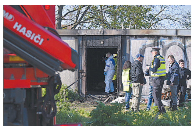
5月4日,警方在捷克布尔诺的火灾现场工作。当地消防部门4日称,捷克第二大城市布尔诺的一处房屋当日凌晨发生火灾,造成8人死亡。

新华社华盛顿5月3日电 美国劳工部日前宣布,该部门一项调查发现美国3家麦当劳特许经营商非法雇佣300余名童工。 该调查显示,这3家麦当劳特许经营商在肯塔基、印第安纳、马里兰州和俄亥俄州经营62处麦当劳餐厅,合计雇佣305名童工,从事法律不允许该年龄段工人进行的操作。 劳工部说,这3家麦当劳特许经营商被合计处以约21.3万美元的民事罚款。该部门一名官员表示,违反联邦法律雇佣童工的现象正在增加。 另据该部门统计,在2022财年发现688名儿童被非法雇佣从事危险工作,为2011财年以来的最高数字。去年6月,一名15岁未成年人在田纳西州莫里斯敦市一处麦当劳餐厅操作油炸机时受伤。