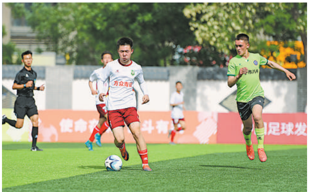
5月14日,由教育部、国家体育总局指导,中国足球协会主办的2023第二届中国青少年足球联赛(男子高中年龄段U17组)北区预选赛(宁夏赛区)的比赛分别在宁夏青少年足球训练基地、银川高级中学两个赛区举行。