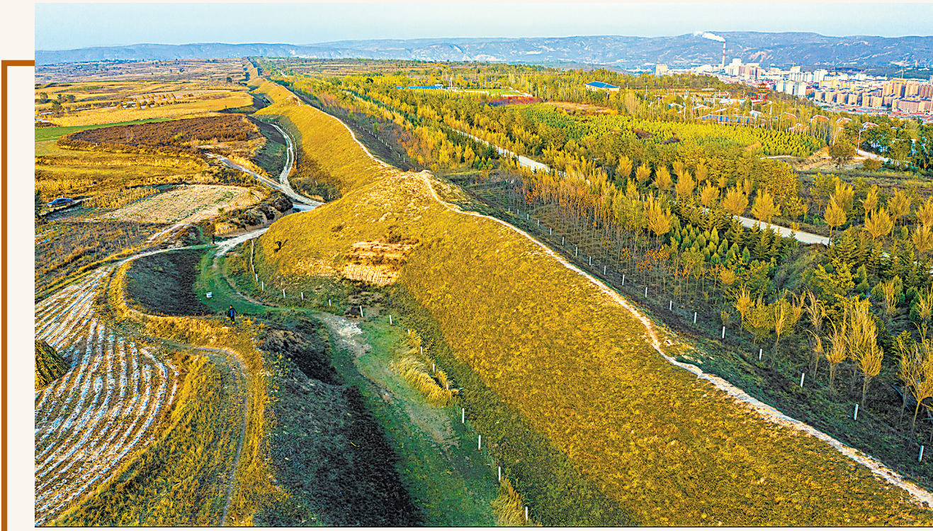
战国秦长城原州区境内长城梁段。(资料图片)