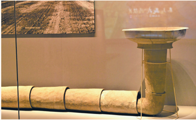
保存完整的陶制排水系统。