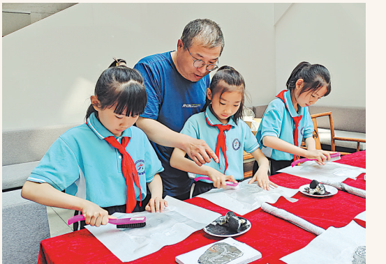
5月18日，孩子们跟随自治区级岩画复刻非遗传承人体验岩画拓印。当天，中卫市博物馆开展“5·18国际博物馆日”暨“宁夏长城保护宣传日”系列宣传活动。馆中“寻宝”、岩画拓印、文创拼图等线下体验活动，深受观众喜爱。

本报讯（记者 王刚 见习记者 杨玉瑛）5月18日是第47个国际博物馆日。当天，固原博物馆联合宁夏文物考古研究所共同举办“发现获国——宁夏彭阳姚河塬西周城址考古成果展”，此次展览是对2017年以来彭阳姚河塬西周城址考古发掘成果的首次全面呈现，正式拉开水洞沟遗址发现暨宁夏考古百年系列活动的序幕。 活动现场，自治区文化和旅游厅发布了宁夏考古百年系列活动和全区博物馆主题文化旅游路线。固原博物馆和固原市各博物馆现场签署博物馆联盟框架协议，组成该市博物馆行业联盟。开展公益性文物鉴定咨询、博物馆公益讲座、游馆集章·打卡纪念等16项活动。同时，采取“文创+”方式，推出数字展览与数据共享服务，广泛开展云展览、云教育等活动，让游客足不出户就能线上游玩、参观。 水洞沟遗址发现暨宁夏考古百年系列活动围绕“博物馆、可持续性与美好生活”“传承弘扬长城文化，打造保护利用典范”“发现·见证·中华文明”主题，组织展览展示、公益鉴定、公益讲座、教育传播等活动155项，搭建起博物馆与公众沟通的平台，普及宁夏百年考古成果，讲好宁夏文物故事。8月前后将开展“寻找宁夏最美文物安全守护人”评选推介等活动，编辑出版一批考古研究成果，推出一批文物科普读物。系列活动将持续至今年10月。