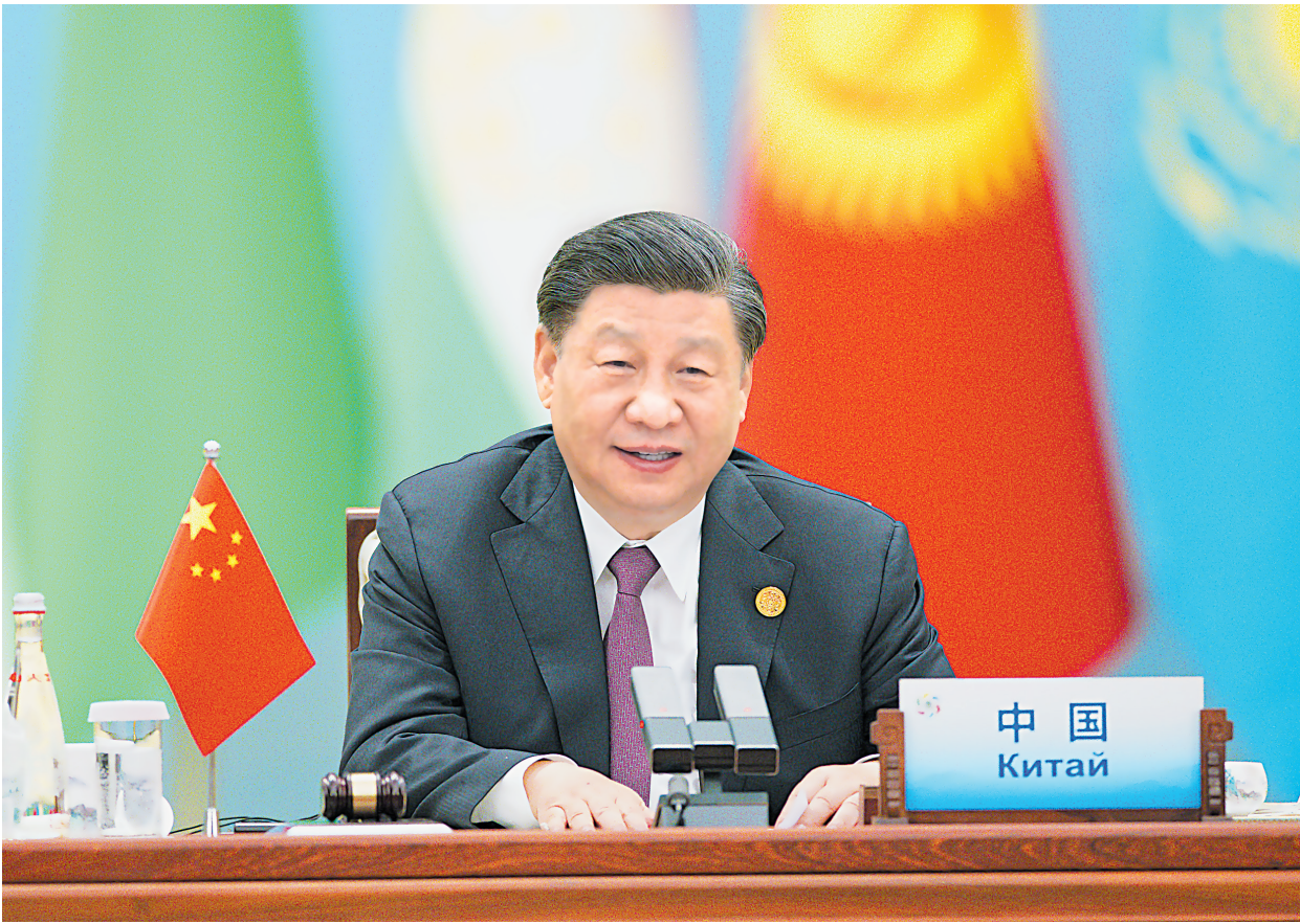
5月19日上午,国家主席习近平在陕西省西安市主持首届中国-中亚峰会并发表题为《携手建设守望相助、共同发展、普遍安全、世代友好的中国-中亚命运共同体》的主旨讲话。