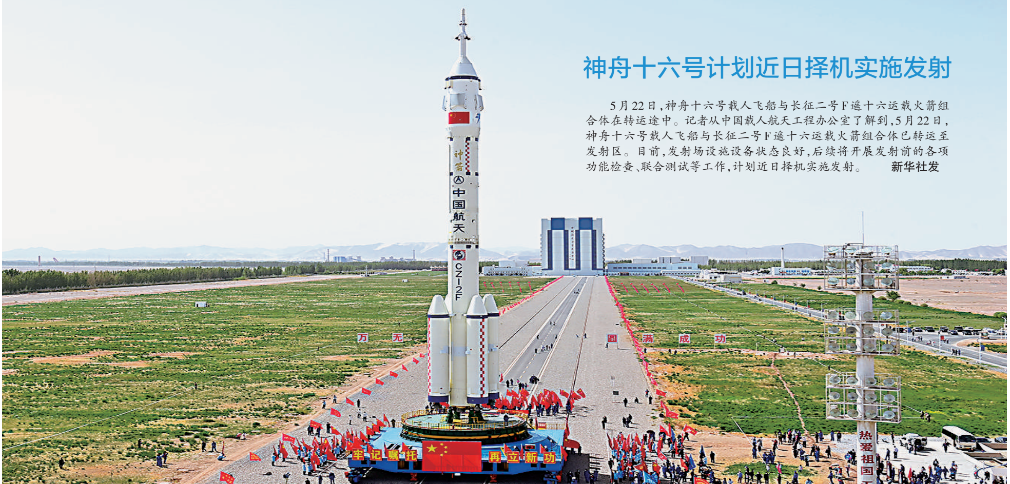
神舟十六号计划近日择机实施发射

培训,提高劳动生产率;另一方面,要深化人才发展体制机制改革,改进人才评价机制,破除“唯论文、唯职称、唯学历、唯奖项”等沉疴顽疾,激发各类人才创新创造活力,努力实现人力资源的高效开发利用。 人口问题始终是一个全局性、战略性问题,必须以系统观念统筹谋划,以改革创新推动发展。要统筹好人口发展与安全,实现人口与经济社会、资源环境的高水平动态平衡和良性互动,加快塑造素质优良、总量充裕、结构优化、分布合理的现代化人力资源,把人口发展的主动权牢牢掌握在自己手里。 (新华社北京5月22日电)