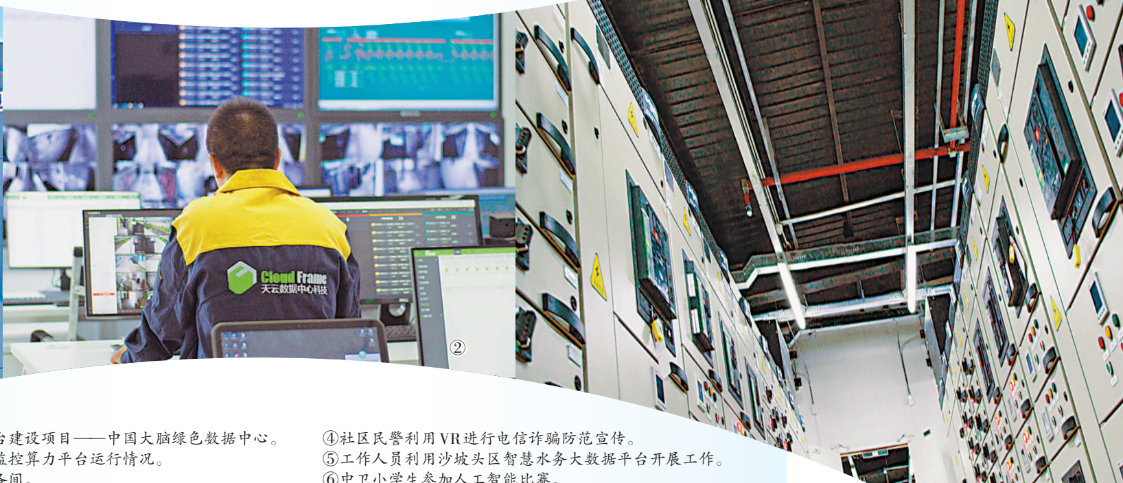
④社区民警利用VR进行电信诈骗防范宣传。