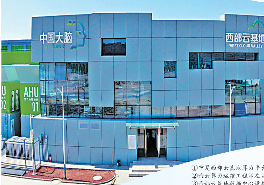
①宁夏西部云基地算力平台建设项目——中国大脑绿色数据中心。