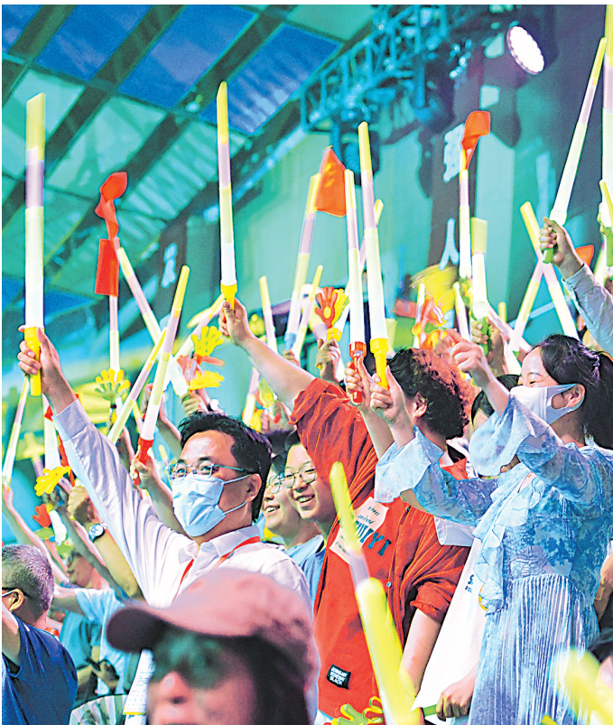
东道主中卫代表队出场,现场观众报以热烈欢呼。