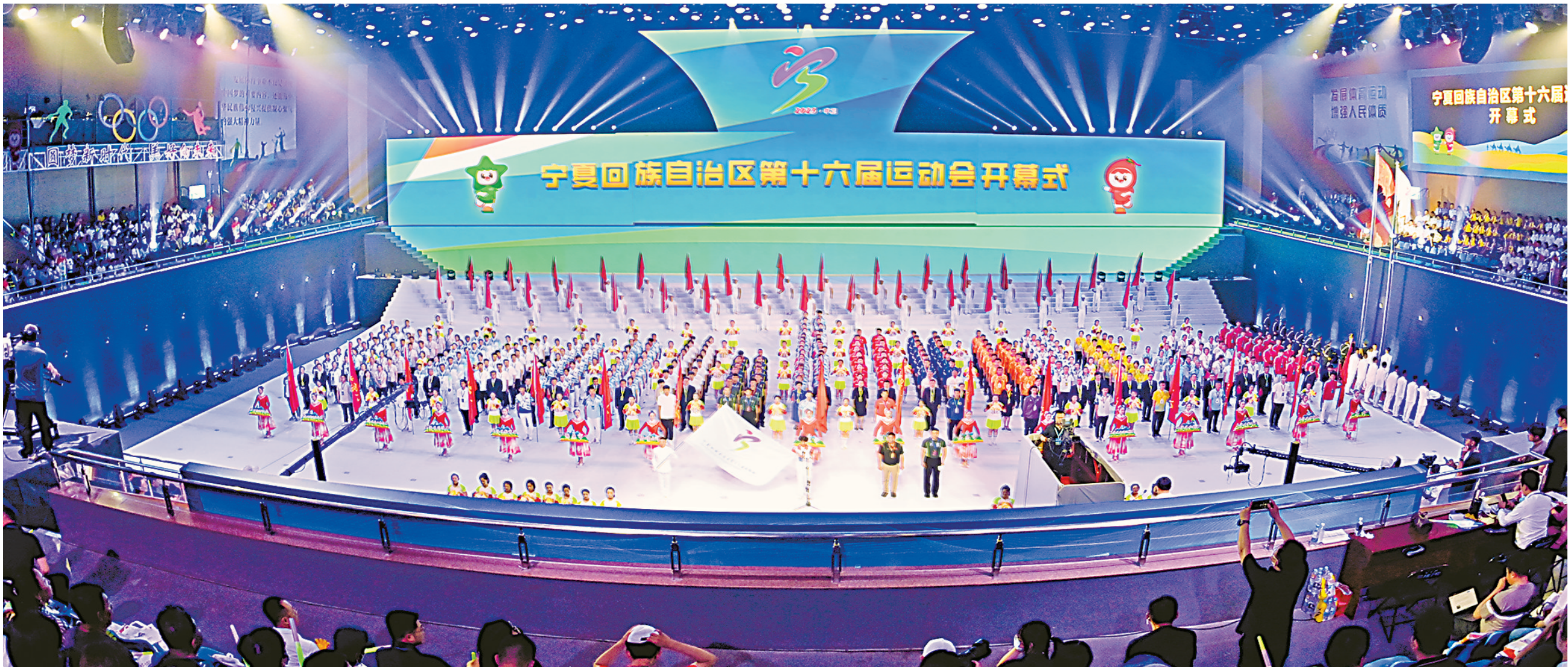
6月16日,自治区第十六届运动会开幕式在中卫市举行,文体展演精彩纷呈。