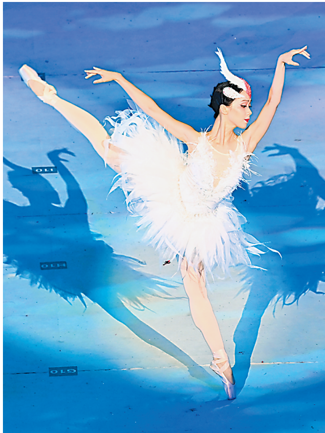
“天鹅”起舞,万籁共生。得益于“治沙魔方”麦草方格,宁夏实现了人进沙退的历史性转变,推进人与自然和谐共生。