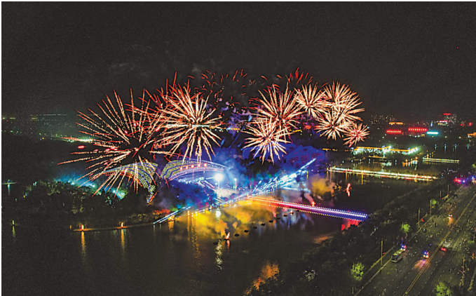
开幕式尾声,中卫市体育馆上空烟花燃起。