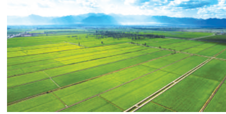
农田犹如碧波，与远山构成一幅和谐画卷。