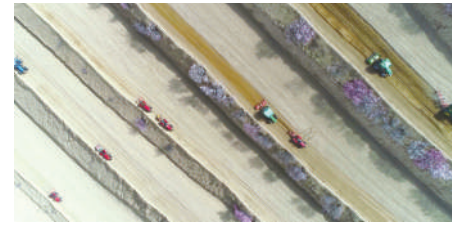
在固原市彭阳县，农民驾驶农机劳作。