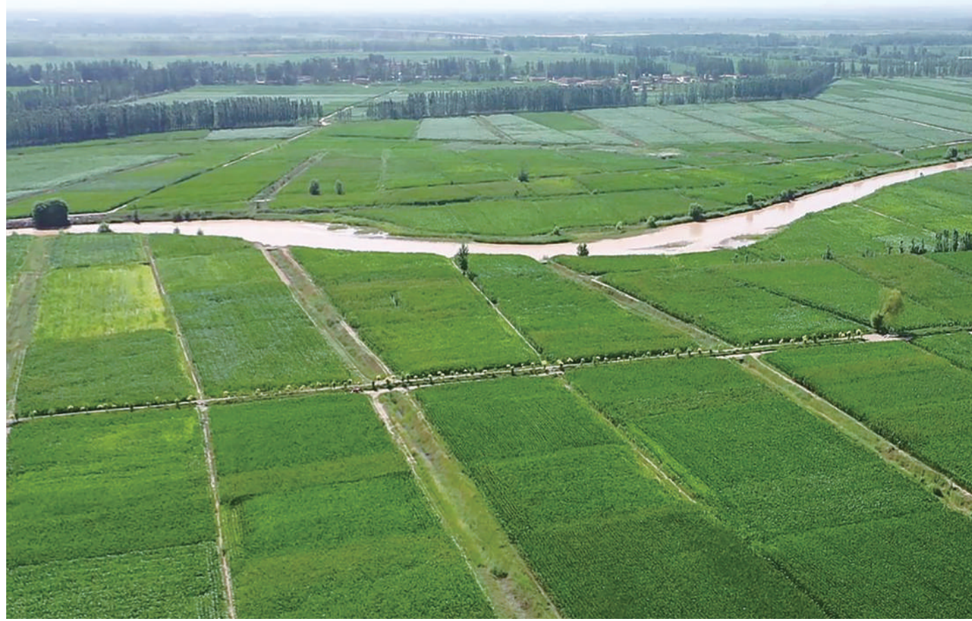
夏日里，吴忠市现代化生态灌区绿意盎然。