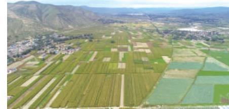
实行最严格的耕地保护和占补平衡制度，压实耕地保护红线。