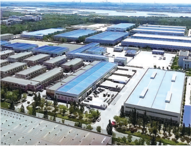
优化土地利用结构布局，推动土地节约集约利用。

我区自然资源部门用实际行动展现了何为“小土地更要追求大发展”。近年来，自治区自然资源厅落实全面节约战略，聚焦黄河流域生态保护和高质量发展先行区建设，对标自治区土地权改革部署要求，采取一系列举措推进节约集约用地，全力助推经济社会发展全面绿色转型。