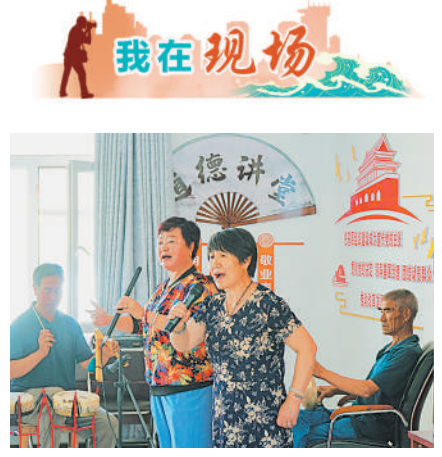
秦腔让移民群众精神文化生活丰富多彩。