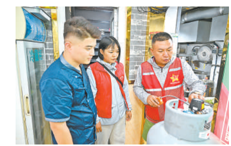
8月3日,银川市金凤区长城中路街道长城花园社区工作人员在辖区进行随机安全检查。