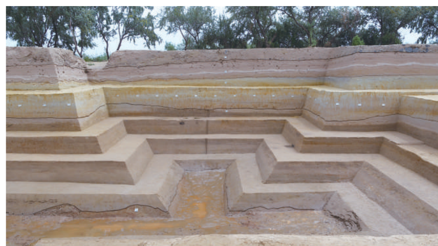
青铜峡鸽子山遗址发掘完成剖面。