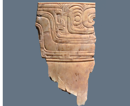
姚河塬墓地出土兽面纹象牙杯。