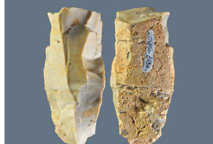
水洞沟遗址出土石叶。