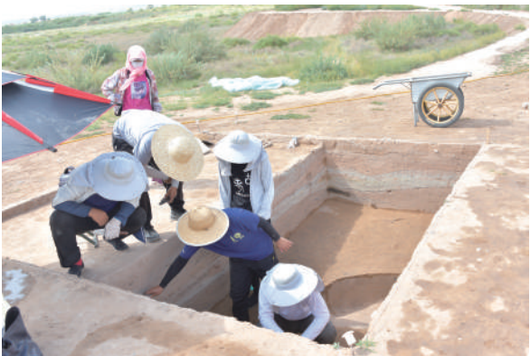
盐池张家场城址发掘现场。

张家场城址位于宁夏盐池县西北花马池镇张家场村西,地处鄂尔多斯台地、毛乌素沙地西南缘。根据以往的考古调查和墓葬发掘,结合文献记载,推断张家场古城为秦末北地郡所属的陶行县城,西汉时期的上郡属国都尉城,后为东汉上郡的龟兹属国城,是秦代后期