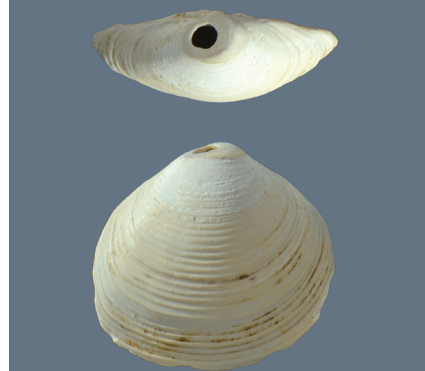
水洞沟遗址出土贝类装饰品。