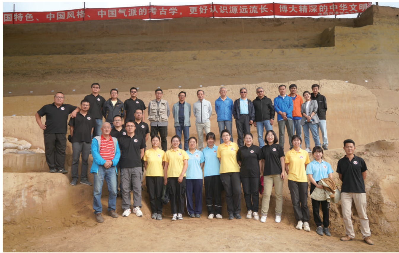
首届旧石器考古高级培训研修班在水洞沟遗址举办。

在新时代宁夏考古取得的重要成就中,灵武水洞沟遗址、青铜峡鸽子山遗址、彭阳姚河塬遗址、盐池张家场城址、贺兰山苏峪口窑窑址、固原开城安西王府遗址,因其多样的文化遗存和独特的学术价值闻名于考古学界,对于深入认识中华文明起源、形成和发展历程,丰富我国百万年的人类史、一万年的文化史、五千多年的文明史具有重要意义。