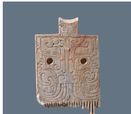
姚河塬墓地出土饗餐纹梳篸。