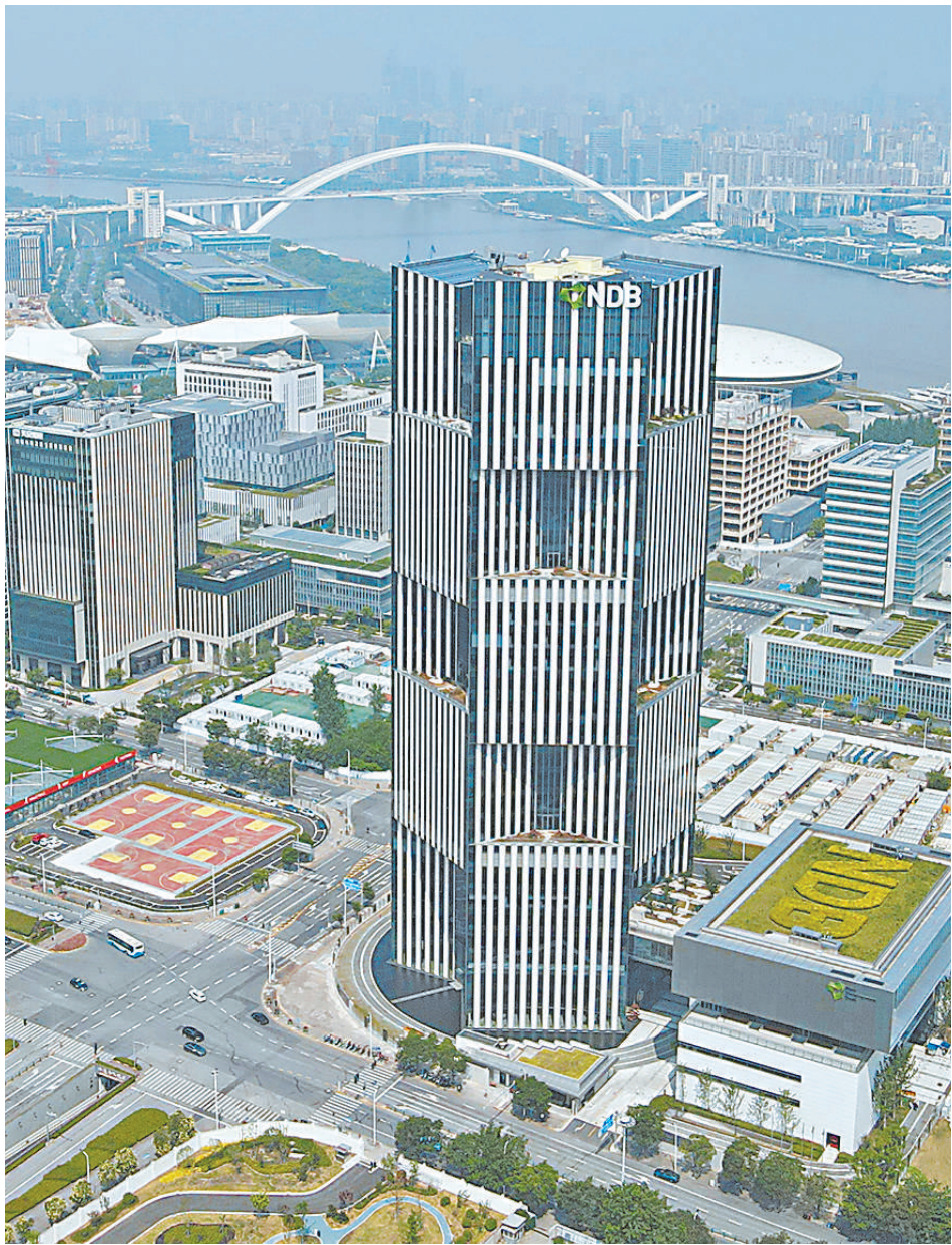
位于上海浦东新区世博园区的金砖国家新开发银行总部大楼(2022年6月17日摄,无人机照片)。 新华社发

非洲,这片被誉为充满希望的大陆,再次迎来远方贵宾。 应南非共和国总统拉马福萨邀请,国家主席习近平将于8月21日至24日出席在南非约翰内斯堡举行的金砖国家领导人第十五次会晤并对南非进行国事访问。在南非期间,习近平主席还将同拉马福萨总统共同主持中非领导人对话会。 2013年3月,习近平主席就任国家主席后首次出访就来到非洲,在南非德班出席金砖国家领导人第五次会晤。今年是金砖“南非年”,也是习近平主席提出真实亲诚对非政策理念和正确义利观十周年。十年间,习近平主席四度踏上非洲大陆,其中三次到访南非,为中非合作擘画蓝图,推动金砖合作机制行稳致远。 当前,世界之变、时代之变、历史之变正以前所未有的方式展开,谋发展、求合作成为发展中国家的共同追求。面对变乱交织的国际形势,习近平主席将同南非及各国领导人一道,为做大做强金砖机制凝聚共识与合力,推动中非合作、南南合作走深走实,为地区和世界和平增添更多稳定性,为共同发展和全球治理带来更多正能量。