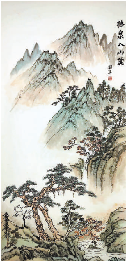
听泉入山麓(国画) 刘宁