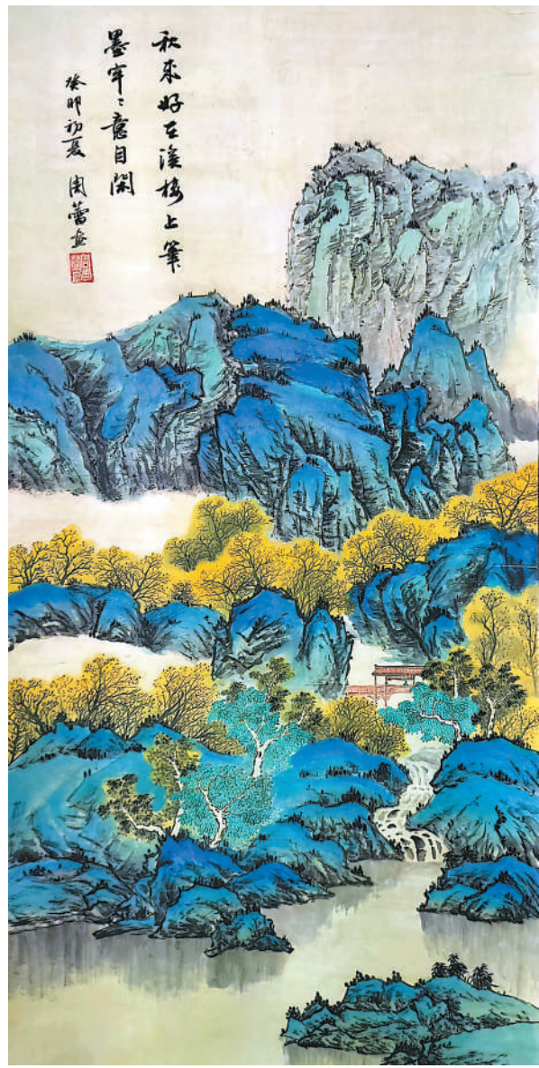
秋来意自闲(国画) 周蕾