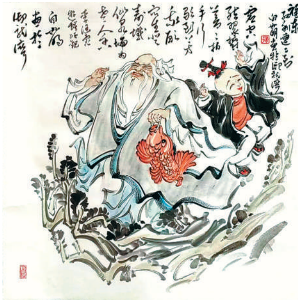
渔乐图(国画 特邀作品) 白如明