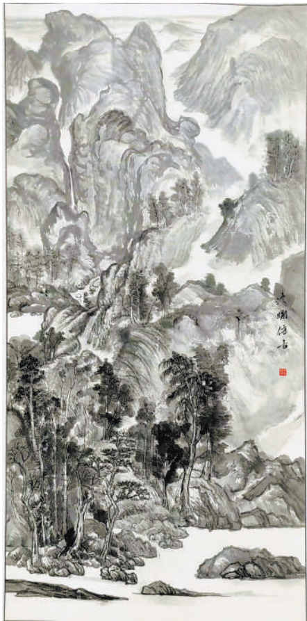
仿古图(国画) 李润洲