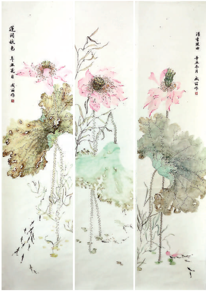
灵州荷花(国画) 马成丽