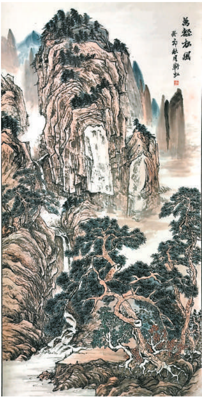
万壑松风(国画 特邀作品) 靳虹