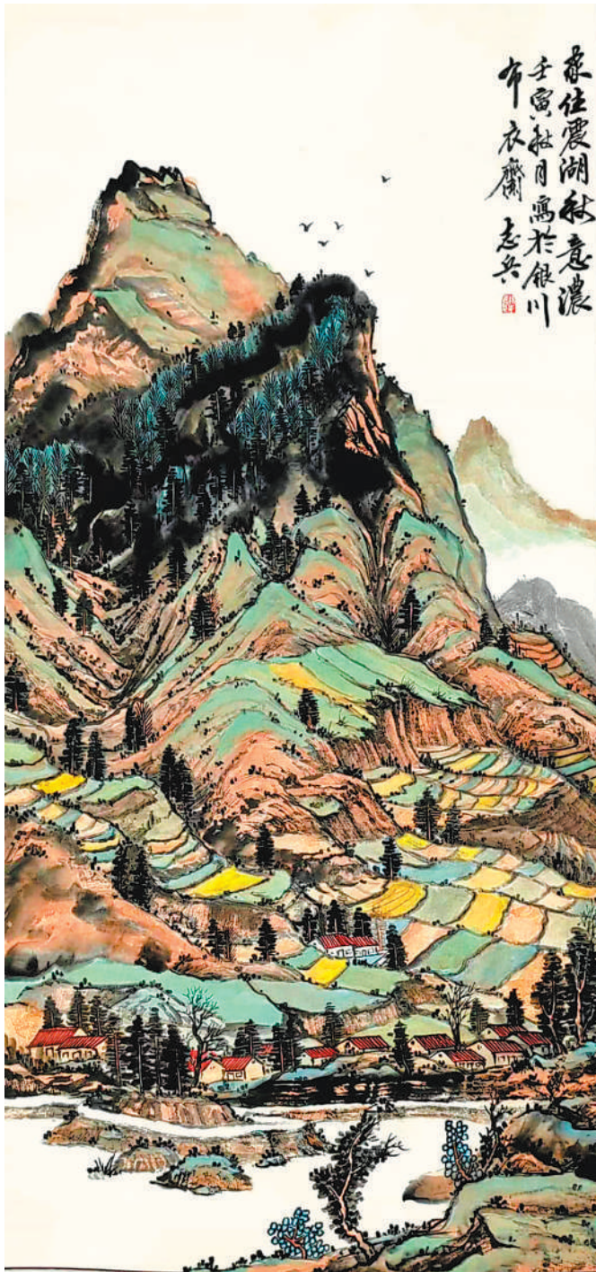
震湖秋意浓(国画 特邀作品) 杨志兵