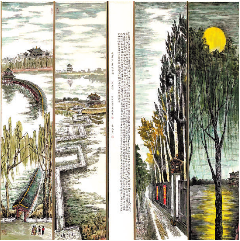
兴唐苑·灵武西湖(国画 特邀作品)

8月31日,灵武市2023年美术作品展“强国复兴有我——九曲黄河几字湾 生态优美人民富”在当地开展。 本次展览展出国画、油画作品90余幅,艺术语言丰富,创作手法多样。近年来,灵武市广大艺术工作者深入生活,扎根基层,着力描绘黄河壶口瀑布、灵武山川风貌等黄河流域生态保护的大美景象。本次展览由灵武市委宣传部、灵武市文联、灵武市美术家协会等联合举办,旨在用有温度、有情怀的美术作品讲好灵武故事。