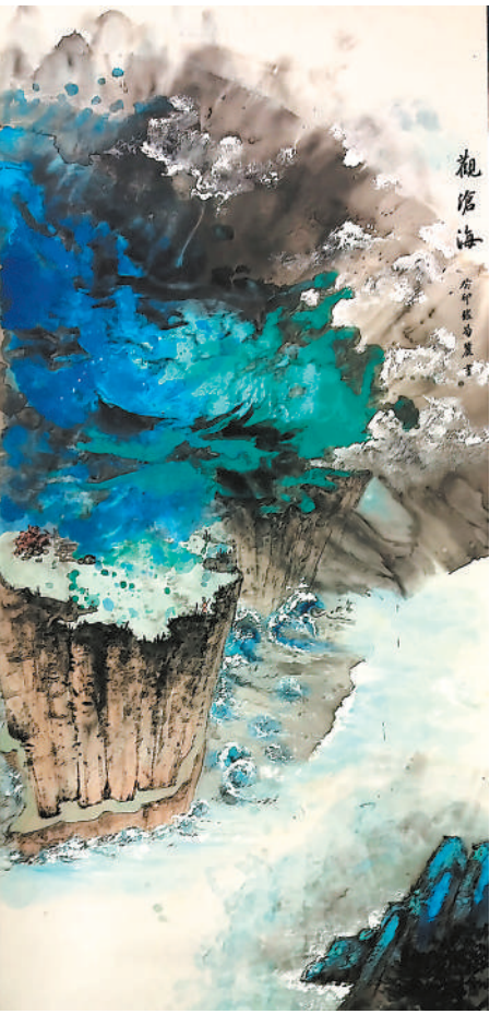
观沧海(国画) 张荀丽