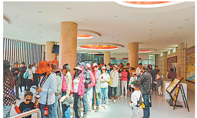
↑前来参观的游客络绎不绝。