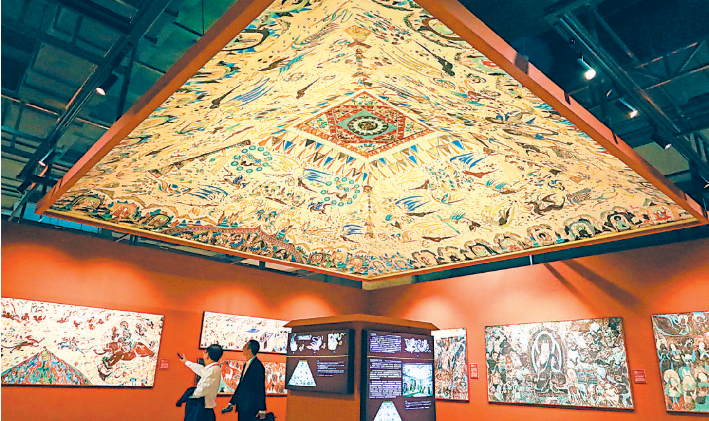
9月6日,与会嘉宾在第六届丝绸之路(敦煌)国际文化博览会上参观敦煌文化主题展。当日,第六届丝绸之路(敦煌)国际文化博览会在甘肃省敦煌市开幕。本届敦煌文博会以“沟通世界:文化交流与文明互鉴”为主题。50多个国家、地区和国际组织的1200多名嘉宾参会。

国家网信办对知网(CNKI)依法作出网络安全审查行政处罚 据新华社北京9月6日电 国家互联网信息办公室6日发布通报称,对知网(CNKI)依法作出网络安全审查相关行政处罚的决定,责令停止违法处理个人信息行为,并处人民币5000万元罚款。 通报表示,根据网络安全审查结论及发现的问题和移送的线索,国家互联网信息办公室依法对知网(CNKI)涉嫌违法处理个人信息行为进行立案调查。经查实,知网(CNKI)主要运营主体为同方知网(北京)技术有限公司、同方知网数字出版技术股份有限公司、《中国学术期刊(光盘版)》电子杂志社有限公司三家公司,其运营的手机知网、知网阅读等14款App存在违反必要原则收集个人信息、未经同意收集个人信息、未公开或未明示收集使用规则、未提供账号注销功能、在用户注销账号后未及删除用户个人信息等违法行为。 9月1日,国家互联网信息办公室依据网络安全法、个人信息保护法、行政处罚法等法律法规,综合考虑知网(CNKI)违法处理个人信息的性质、后果、持续时间,特别是网络安全审查情况等因素,对知网(CNKI)依法作出网络安全审查相关行政处罚的决定,责令停止违法处理个人信息行为,并处人民币5000万元罚款。